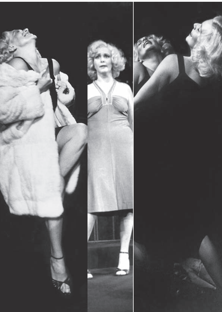
Os Filhos de Kennedy