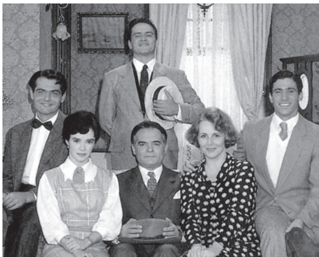
Éramos Seis, com Tarcísio Filho, Luciana Braga, Jandir Ferrari, Othon Bastos e Leonardo Brício