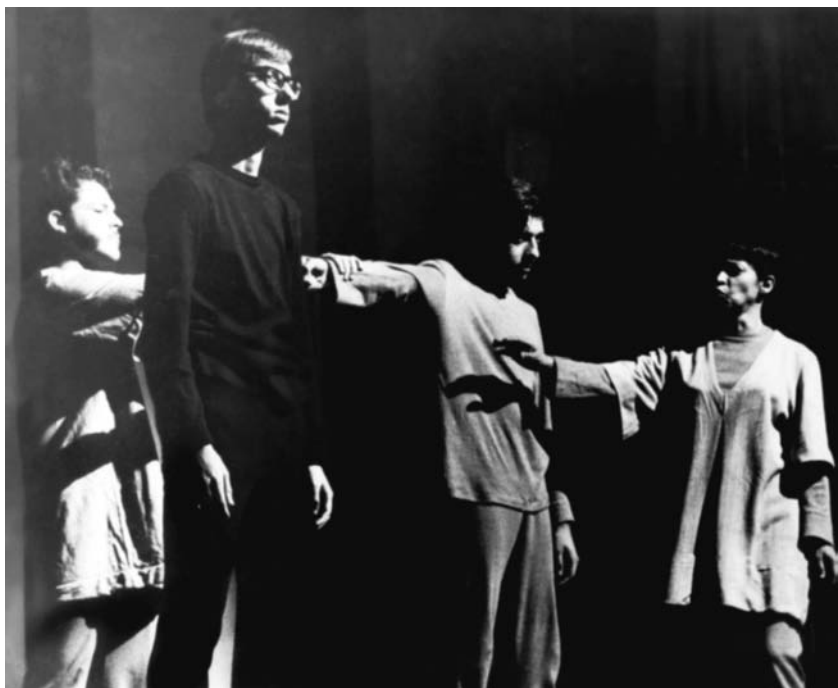
Cristo versus Bomba, em Brasília, 1968