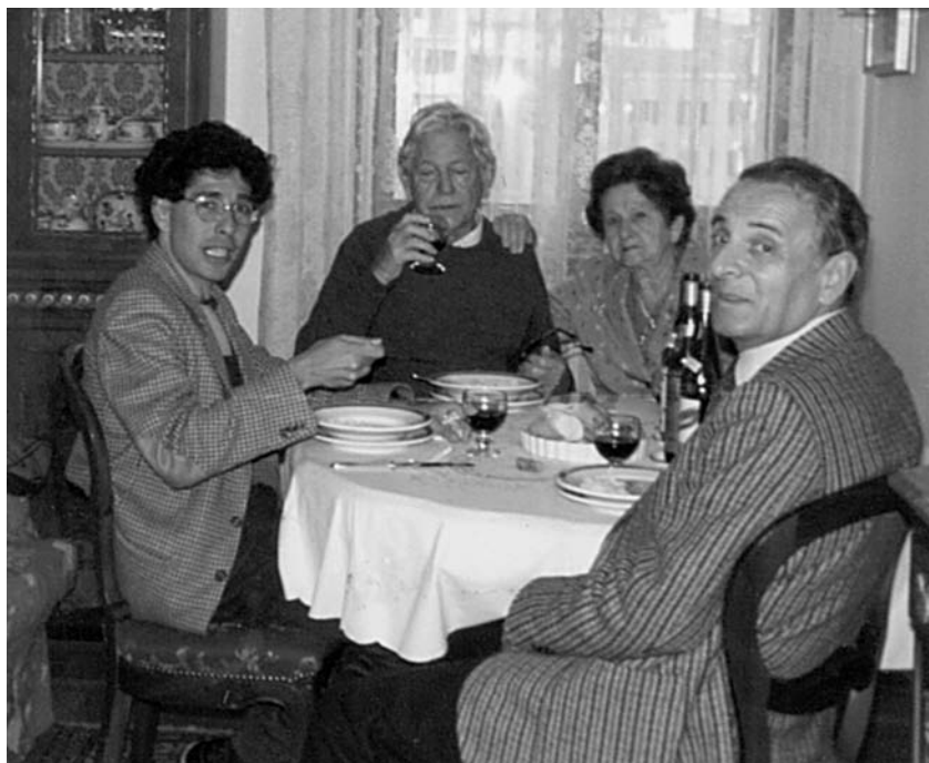
Na Itália, com os pais