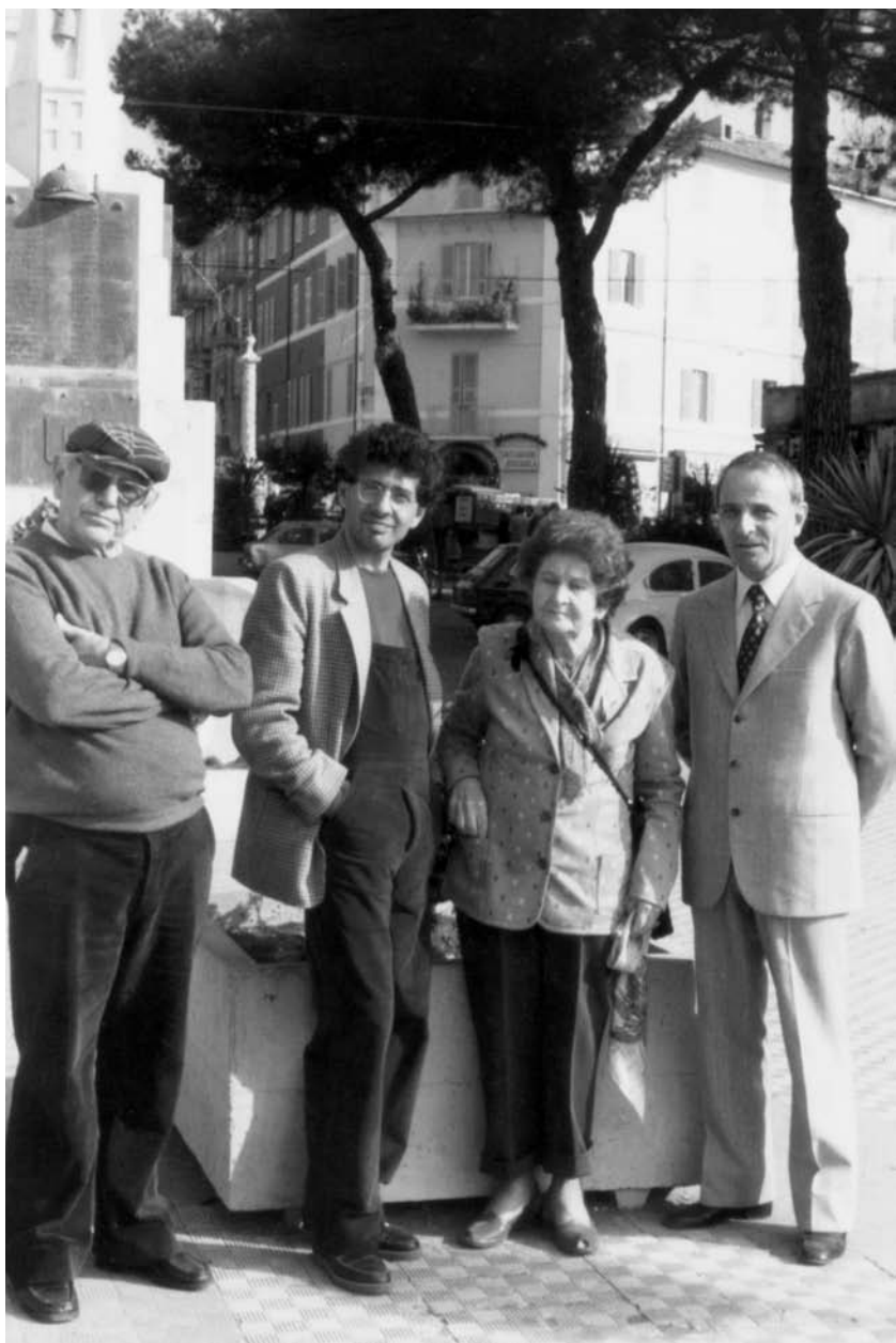
Na Itália, com os pais, 06 de novembro de 1982