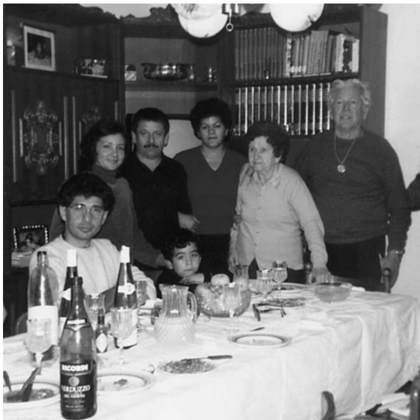
Na Itália, com os pais, 1982