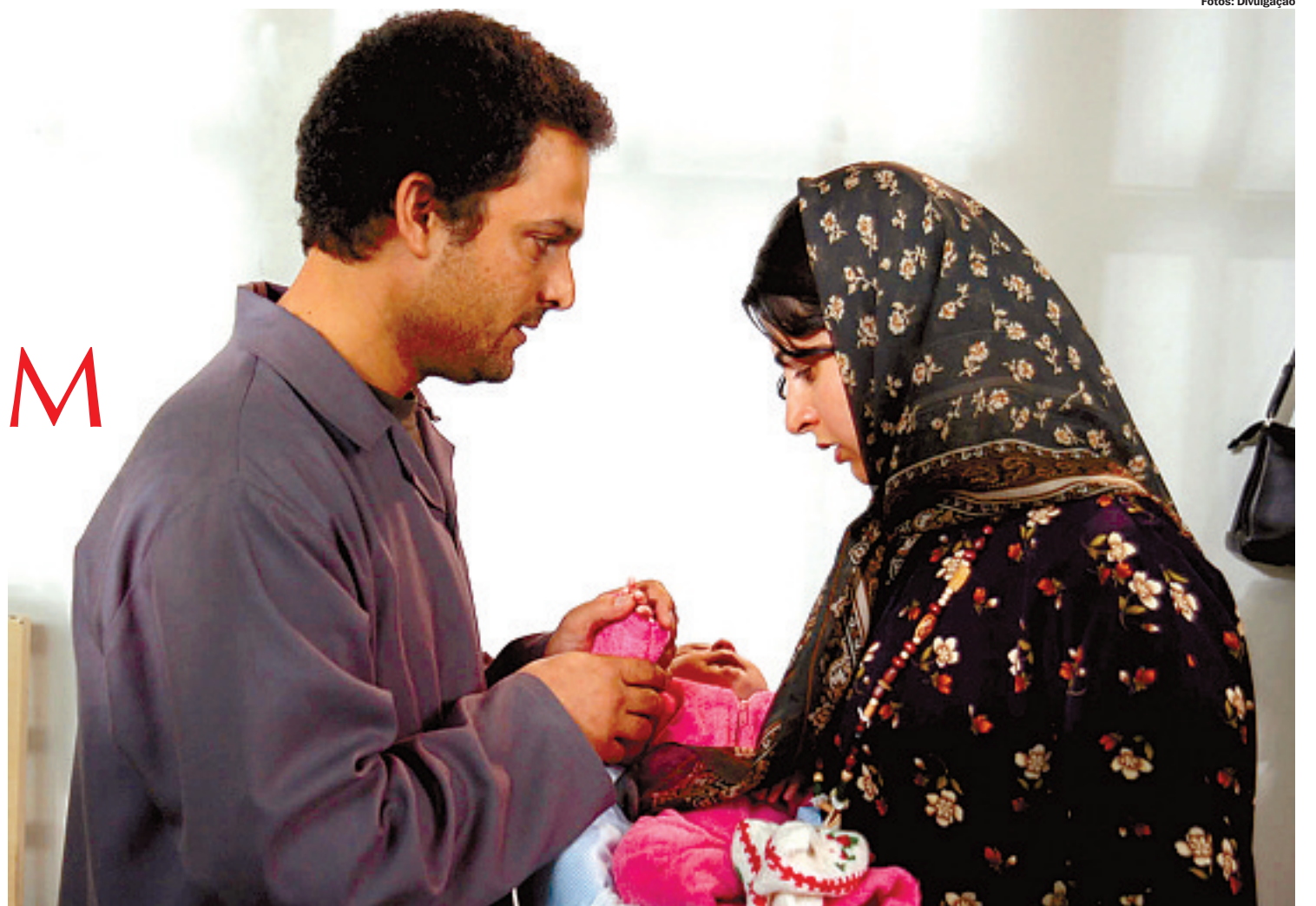
O longa-metragem iraniano Dia de Decisão é atração no evento, que aborda os ritos de passagem sob o olhar de diversas crenças religiosas

Já o iraniano, exibido na Mostra Internacional de Cinema do ano passado, conta a história do prisioneiro Man-