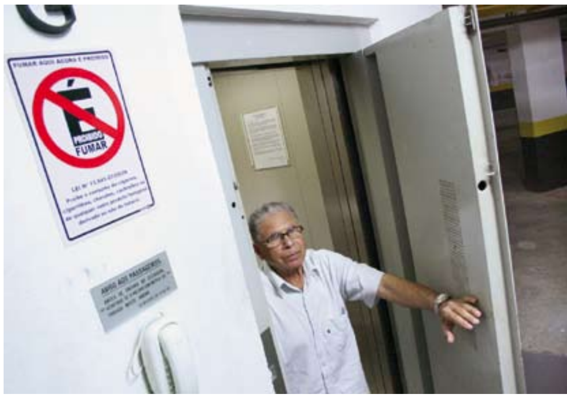
Placas informativas foram instaladas no Condomínio Bandeirantes, em São Bernardo