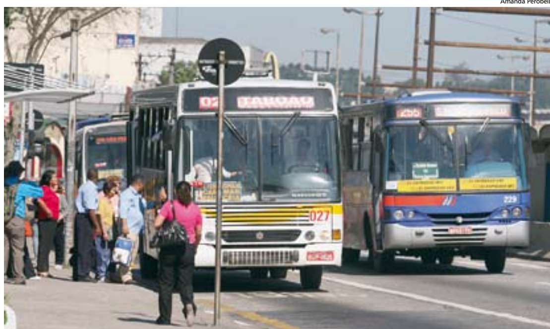
Assaltos a ônibus: aumento de ocorrências em São Bernardo preocupa Administração

O trabalho de inteligência da polícia terá reforço em São Bernardo ainda neste ano. Seguindo prática já adotada em outras cidades da Região, o município de maior população do ABCD – cerca de 800 mil habitantes – adotará o videomonitoramento. As câmeras serão instaladas inicialmente no Centro e depois em bairros e escolas municipais. “Até o final de 2010, a expectativa é ter 200 câmeras espalhadas pela cidade”, adianta Mariano. Diadema, São Caetano e Santo André já contam com videomonitoramento.