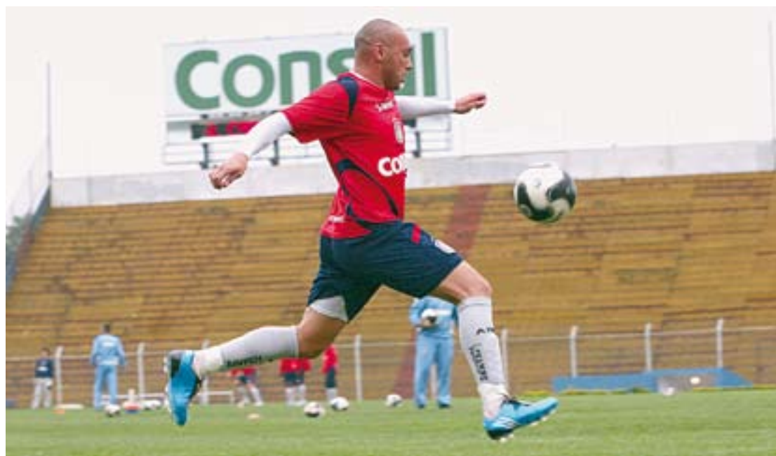
Azulão torce para que América-RN, Ipatinga e Bahia não vençam na rodada

Nos últimos cinco confrontos foram quatro vitórias