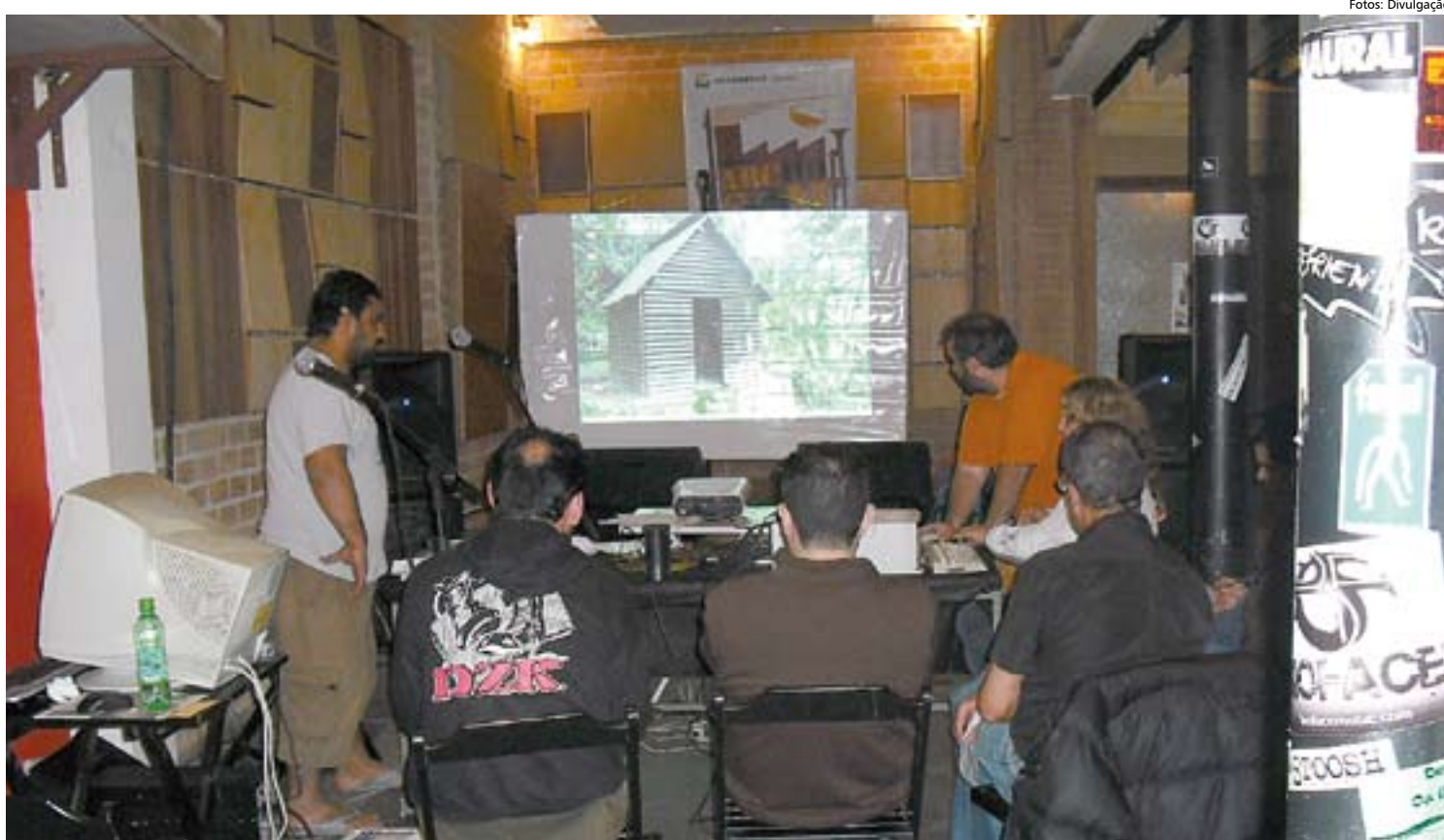
Centro cultural tem um estúdio profissional utilizado para aplicar os cursos que até hoje formaram cerca de 50 pessoas

"Montamos o ABCDo Som a partir de uma demanda que detectamos quando criamos o centro cultural em 2005. Até 2007, 90 bandas já haviam se apresentado no nosso espaço e, nesse ínterim, vimos que várias