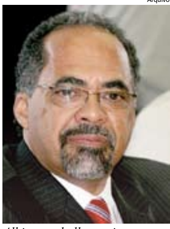
Albino: trabalho conjunto

ALBINO – Vamos entrar com um embargo declaratório sobre a sentença do juiz para que ele afirme, claramente, se concede efeito retroativo ou não sobre a reforma e o empréstimo. Esperamos que ele confirme o efeito retroativo e possamos considerar es-