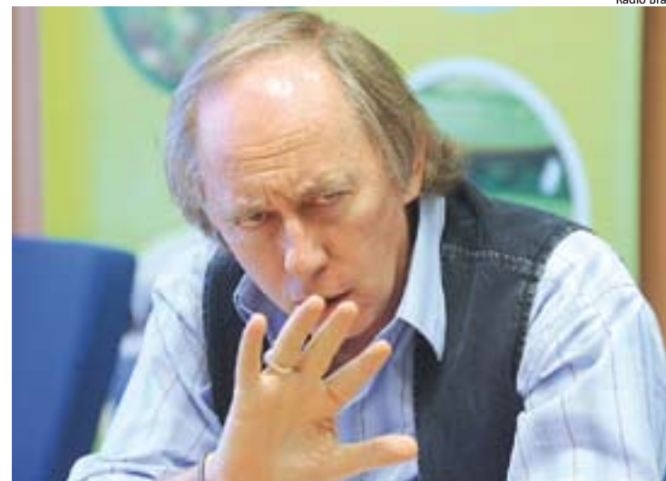
Carlos Minc, ministro do Meio Ambiente

solo do ABCD está contaminado por resíduos industriais há muitos anos e continuará a ser se nada for feito”, lembra Soares.