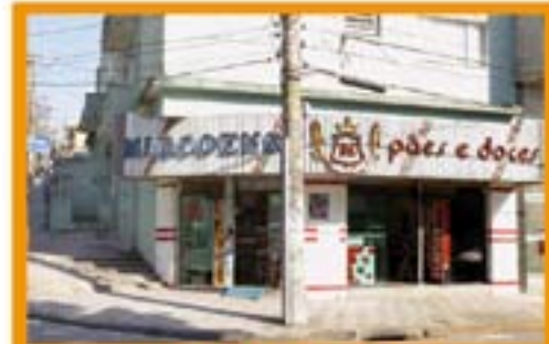
PADARIA MARCOENSE Av. Artur de Aguiar, 1112 - São Bernardo

Ver lista completa no www.abcdmaior.com.br