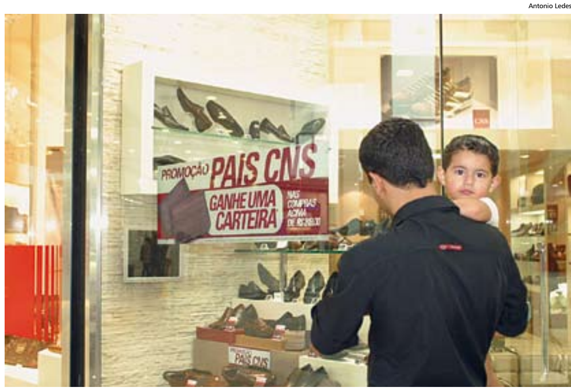
Shopping Metrôpole, em São Bernardo: estimativa é que vendas cresçam 12% neste ano

Quem também optou por liquidar nesta data foi o comércio de rua de Santo André, que prevê um crescimento em torno de 5% nas vendas do Dia dos Pais deste ano em relação ao mesmo período de 2008. Para o pre-