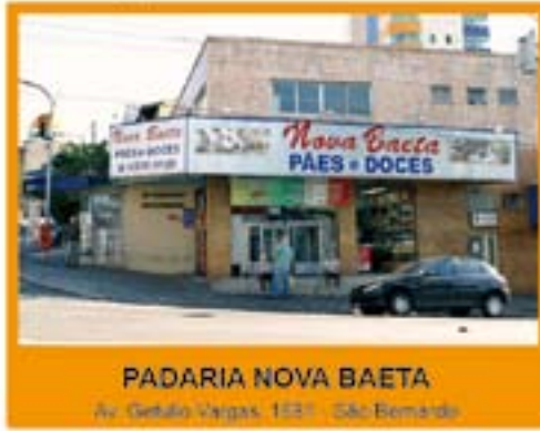
PADARIA NOVA BAETA Av. Getúlio Vargas, 1031 - São Bernardo