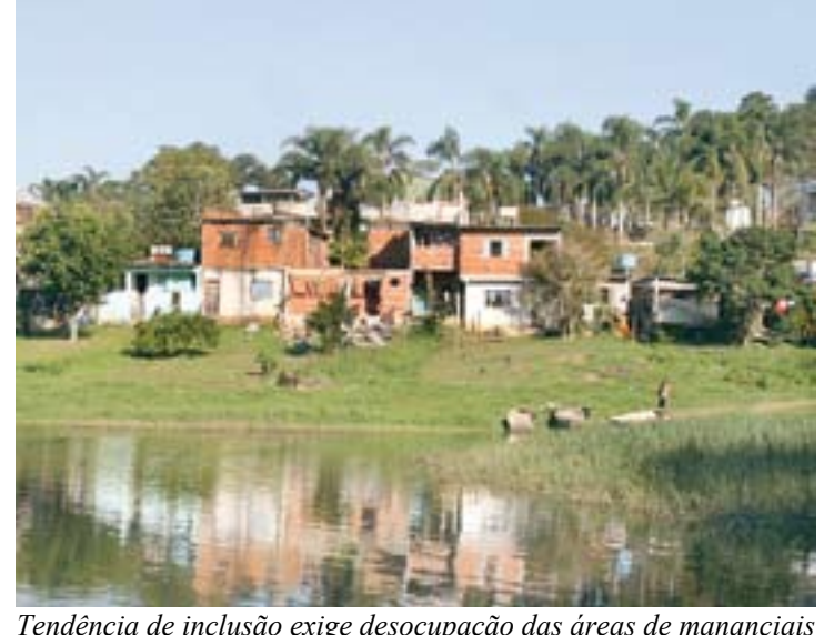
Tendência de inclusão exige desocupação das áreas de mananciais