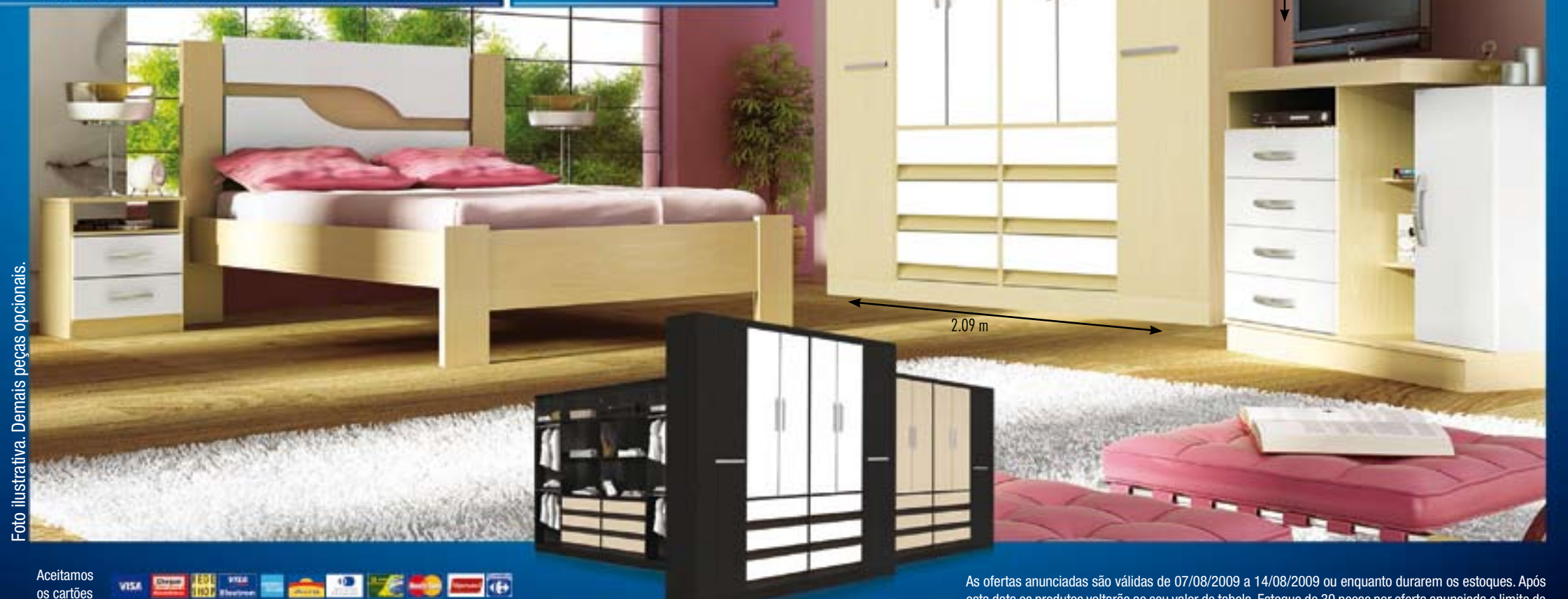
Foto ilustrativa. Demais peças opcionais.

Aceitamos os cartões: VISA, MasterCard, American Express, etc.