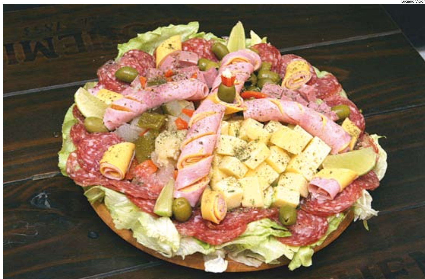
Tábua de frios, preparada com queijos, salame, presunto, picles e azeitona: petisco é a 'menina dos olhos' do cardápio

também marca presença no cardápio do Esphera. Entre os pratos mais pedidos, a porção de batata frita é a que mais se destaca, ao lado dos lanches. "O nosso público varia de 17