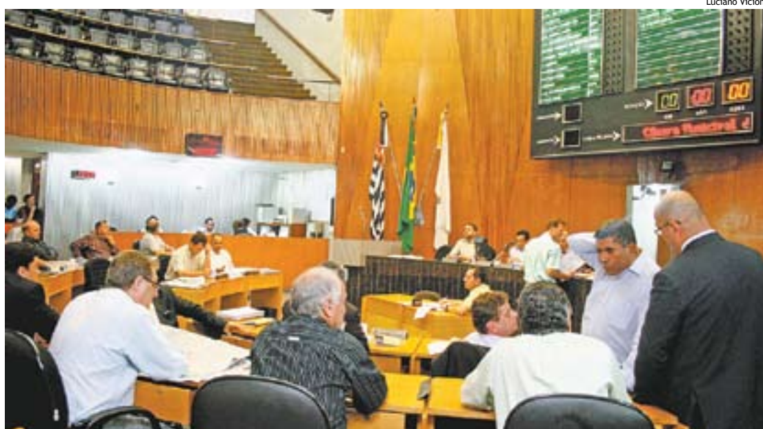
Câmara de São Bernardo deverá acabar com economia a partir do ano que vem