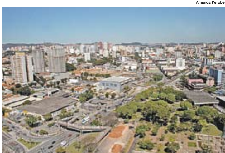
São Bernardo: governo Marinho tem resultado positivo