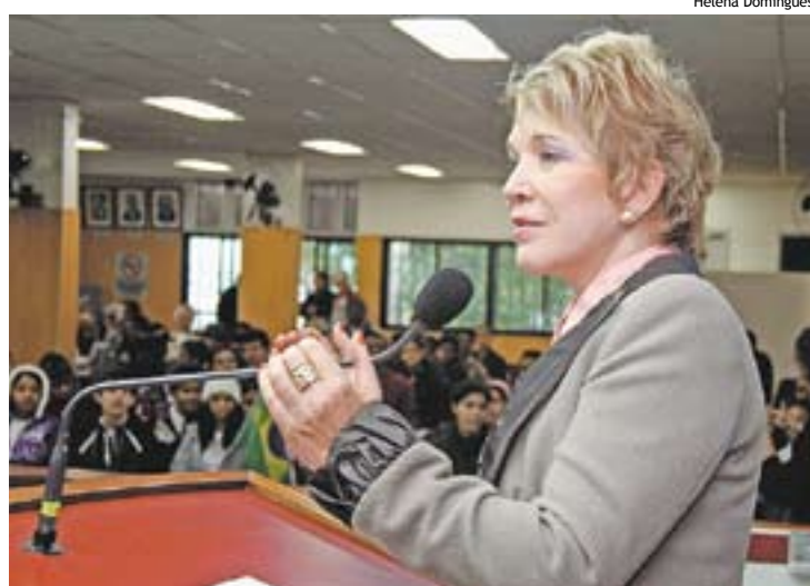
Marta também preparou plataformas eleitorais de Dilma

Outros nomes chegaram a ser aventados para o posto como o prefeito de Osasco,