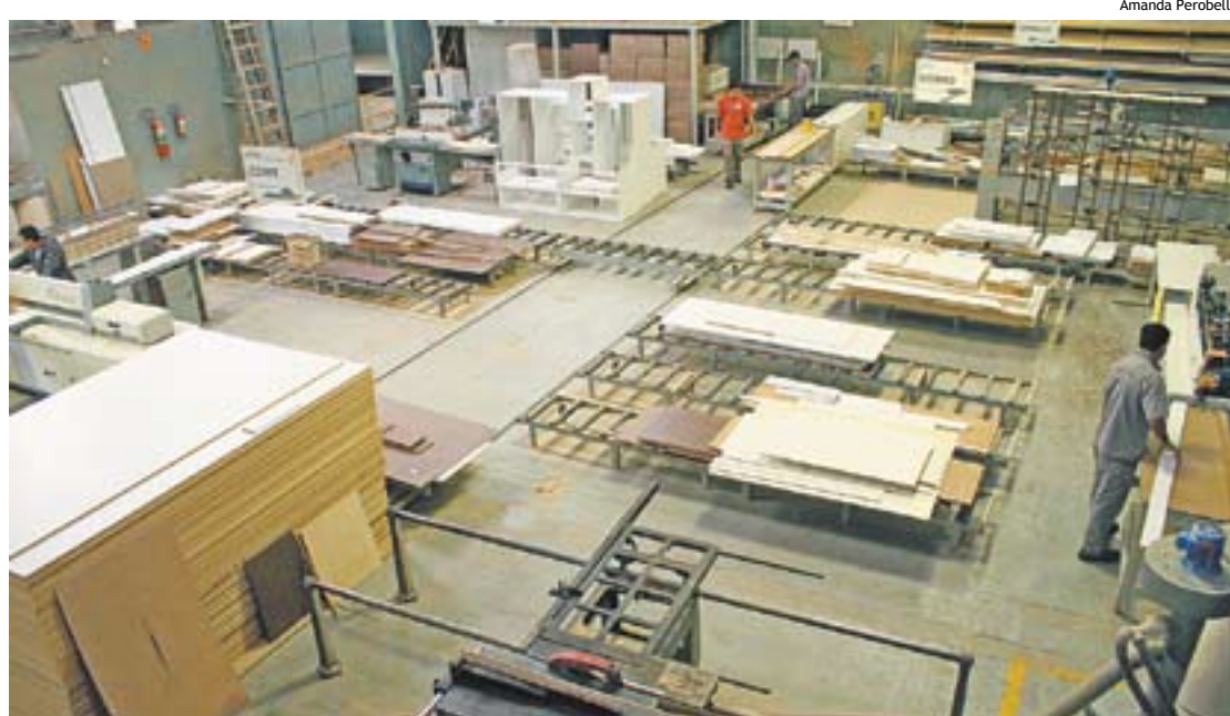
Versalite, fábrica de móveis em operação desde 2000 em São Bernardo: 18 funcionários