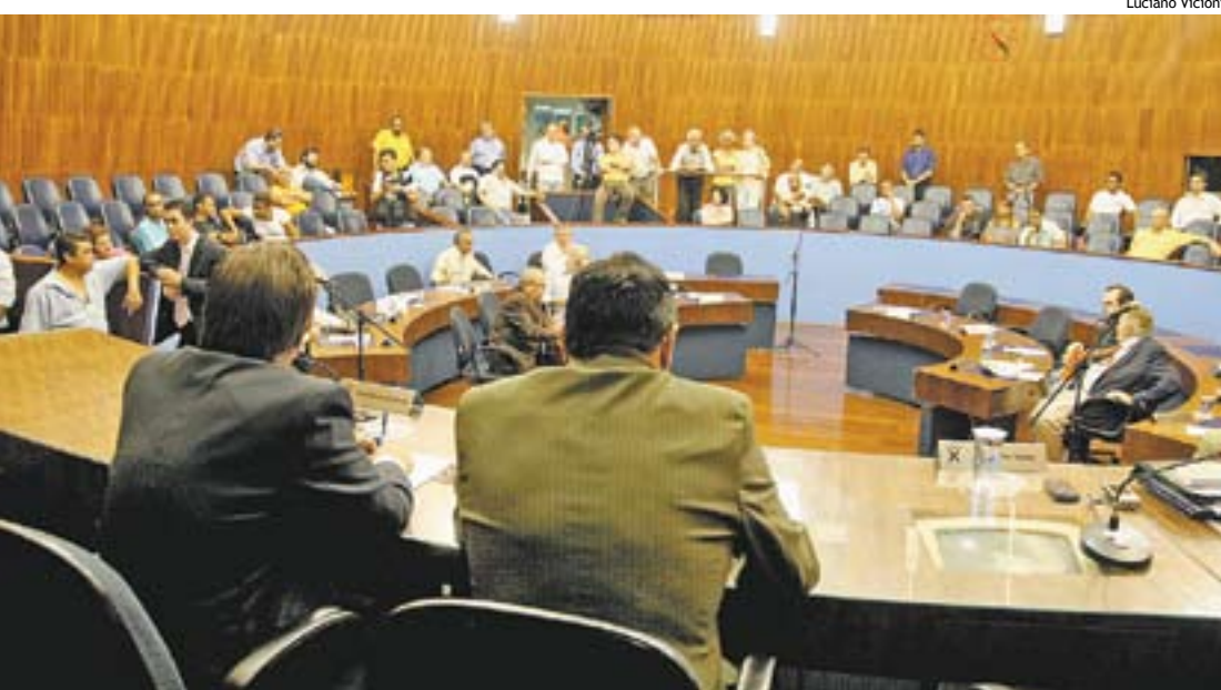
Câmara de Santo André passará de 21 para 27 vereadores após sanção da PEC