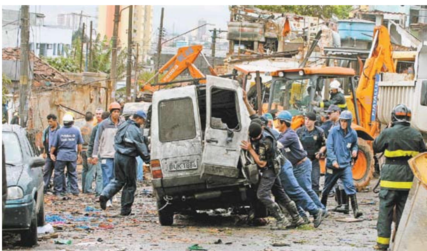
Carro é retirado dos escombros da explosão; acidente mobilizou 50 bombeiros da Região e oito ambulâncias para socorrer feridos