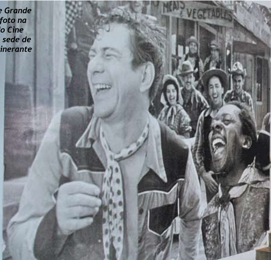
Oscarito e Grande Otelo em foto na entrada do Cine Eldorado: sede de projeto itinerante