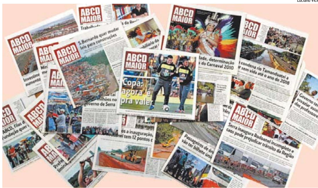
Exemplares do jornal: quatro anos de trabalho transparente que também inclui a web