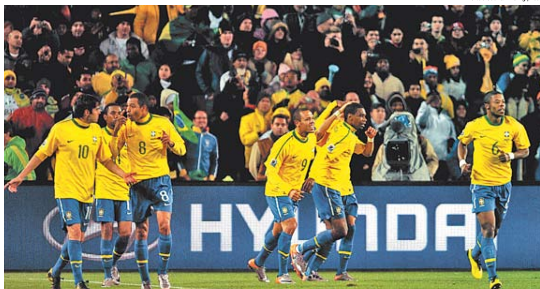
Brasil dá mais um passo rumo ao hexacampeonato mundial ao vencer o Chile

No início do confronto, o Chile adiantou a marcação e dificultou a saída de bola brasileira. Kaká e Robinho não encontravam espaço para a armação das jogadas e as oportunidades eram escassas. A primeira chance surgiu aos nove minutos, quando Gilberto Silva arriscou de fora e obrigou Bravo a fazer uma boa defesa. O mesmo fez Ramires seis minutos mais tarde para outra in-