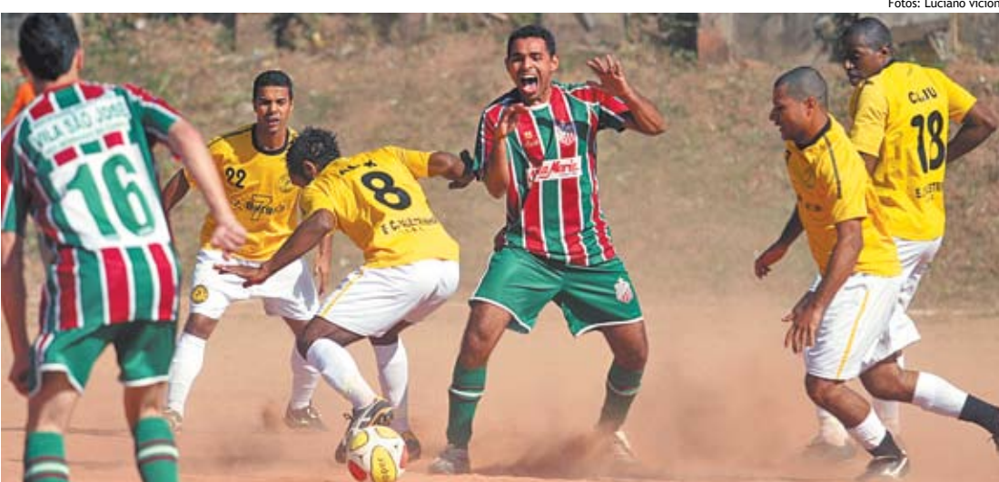
Palestrinha foi o primeiro de seu grupo, mas já havia conquistado a vaga antecipadamente

O Chile partiu para o tudo ou nada e os contragolpes tornaram-se a principal arma brasileira. Apesar disso, o placar não foi alterado e a seleção precisou apenas esperar pelo fim do jogo para comemorar a vaga. ▲