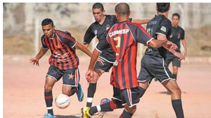
Estrela D ficou na segunda posição do grupo A com 12 pontos

No grupo B, o Palestrinha foi derrotado por 2 a 0 pela Vila