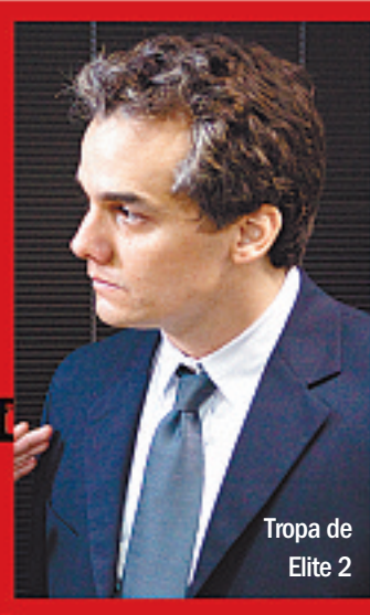
Tropa de Elite 2