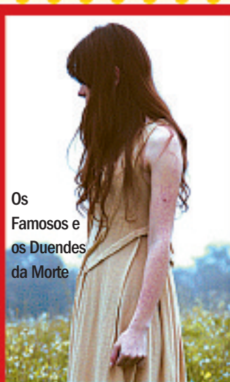
Os Famosos e os Duendes da Morte