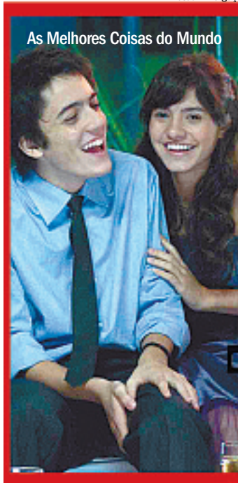
As Melhores Coisas do Mundo