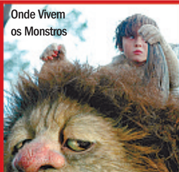
Onde Vivem os Monstros