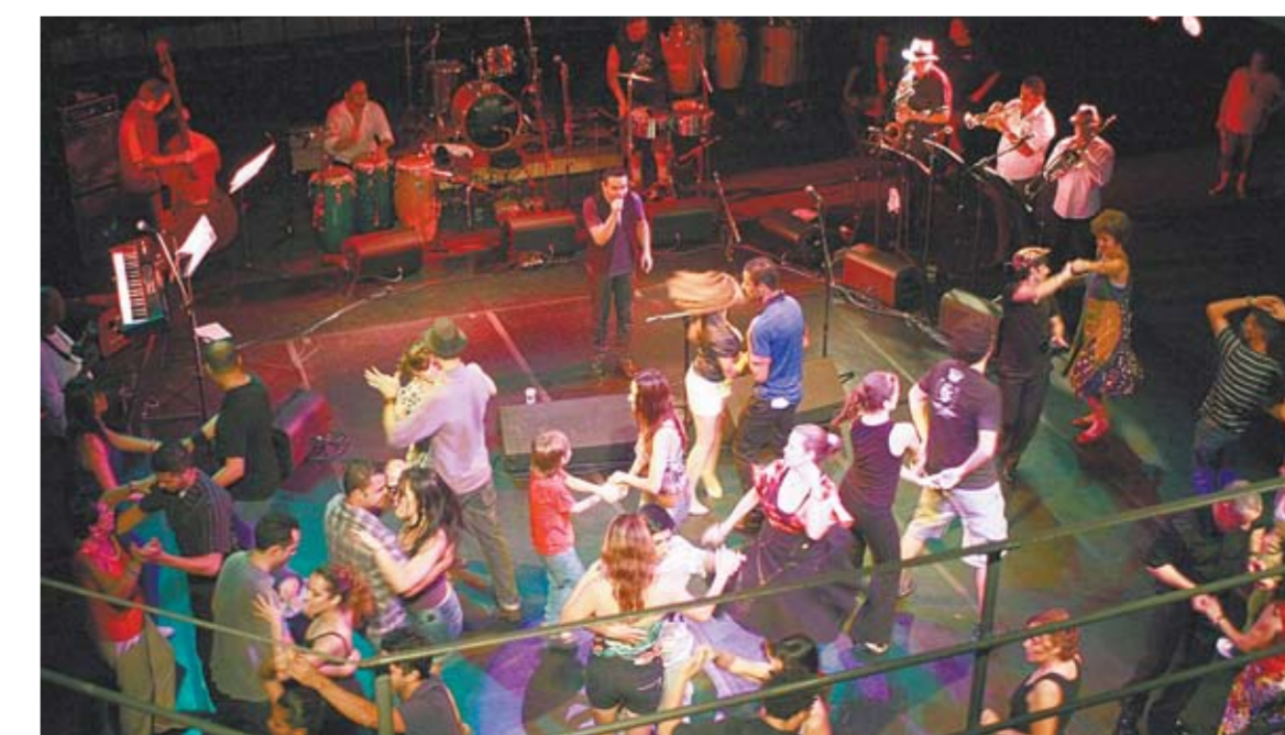
Enquanto grupos se apresentam é possível dançar no projeto "Com Passo Musical", que integra programação de verão