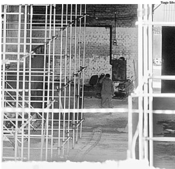
Prefeitura mantém funcionários para vigiar a obra até que seja retomada

Além disso, a pedido do Ministério Público andreense, a obra ficará interditada por 30 dias até que sejam prestados os devidos esclarecimentos so-