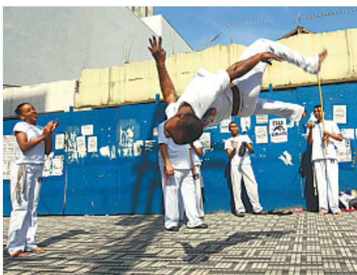
Apresentação de capoeira foi uma das atrações do evento no Centro