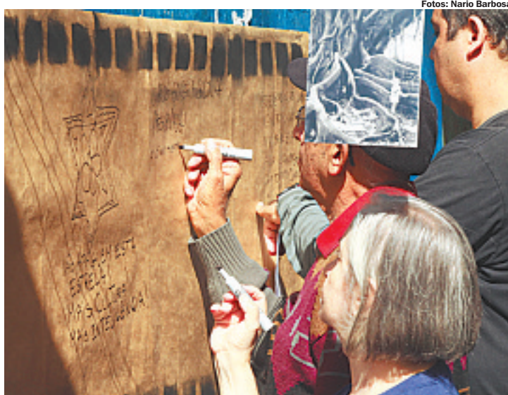
Participantes deixaram recados e cobraram mais atenção à área cultural