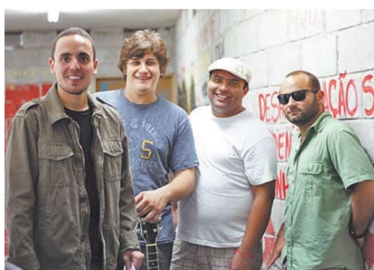
Banda Nervos, da Região, faz as honras da casa com show de abertura

A carreira solo permitiu a vazão para o lado mais blueseiro de Nasi, o que é completamente perceptível e impresso na levada das 17 faixas do disco. Por mais que a intenção seja fazer com que o conjunto da obra “soe rock”, é impossível que o gosto por estilos que deram origem ao rock, como o country, bluegrass e muito do espírito do blues, não contaminem e revelem a tendência de resgate da produção. ■