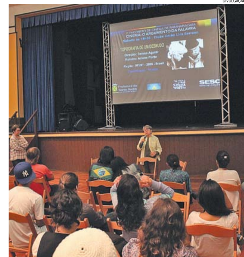
Segunda edição do encontro reuniu dezenas de pessoas em exibições e debates

Para finalizar o Encontro haverá mesa redonda sobre Documentário e Paranapiacaba, com a exibição de produções Parábola da Ladeira, Trilhas e Café, realizadas por alunos da escola. ■