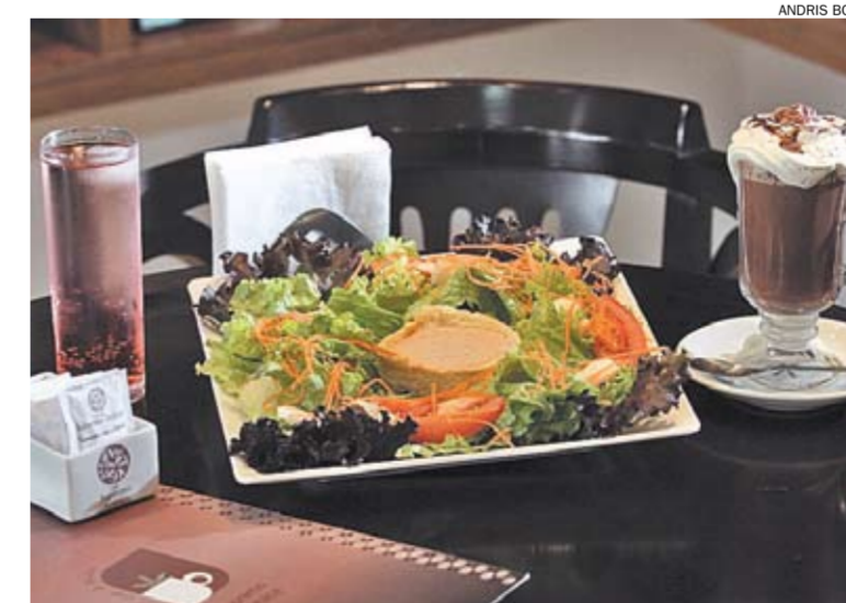
Quiche com salada do Supremo Árabe, onde chocolate quente também é opção

Os desenhos artísticos são outro diferencial, um mimo aos clientes. A cremosidade das bebidas é tamanha que é possível desenhar rosas e corações nos cafés e chocolates. Porém, o Café Supremo não é apenas uma cafeteria. O espaço também serve cerca de 10 pratos, entre saladas, grelhados, sopas e feijoada light. A cada semana há novidades no menu. Uma boa pedida é a quiche