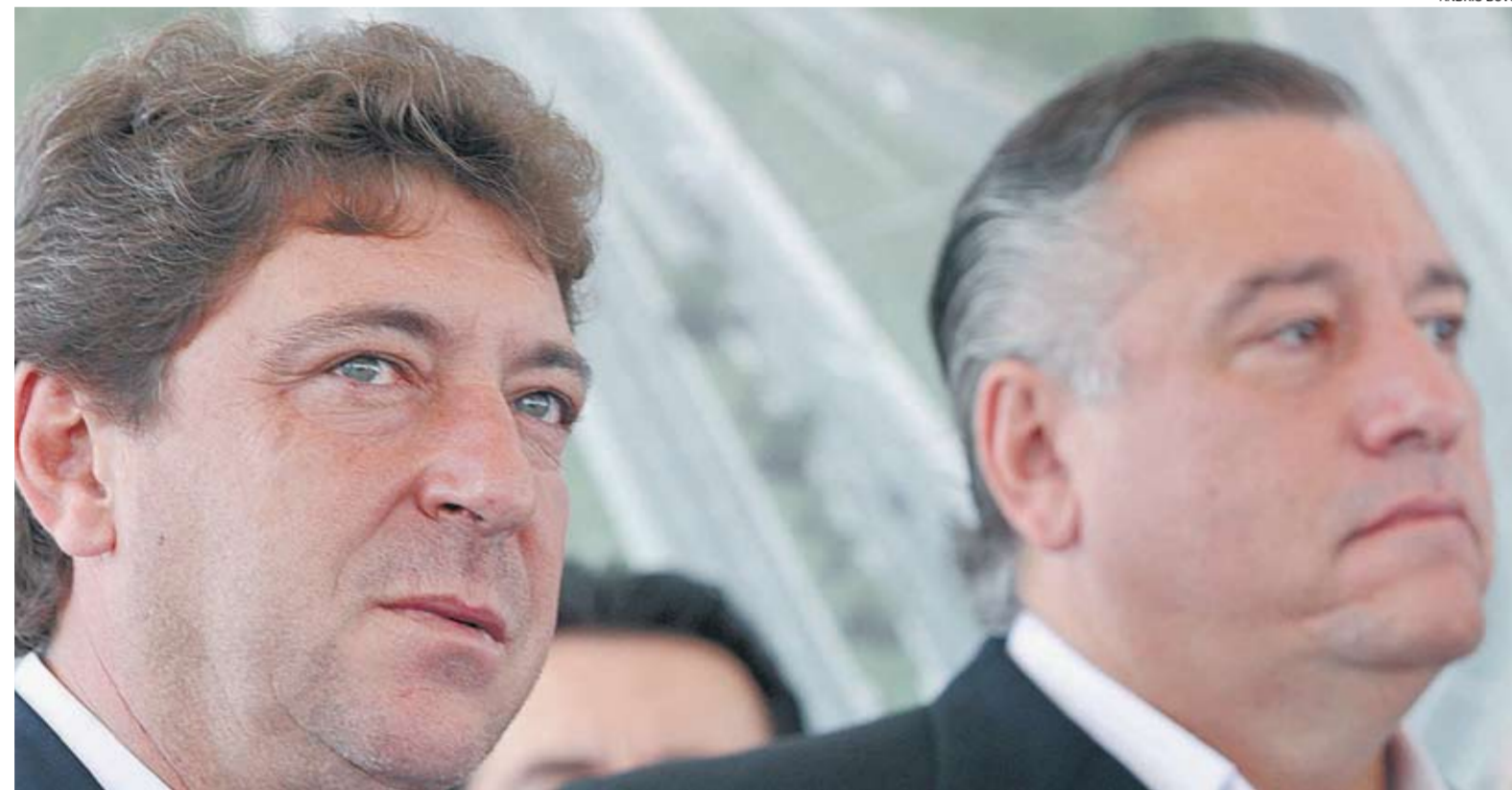
Grana e Aidan: transição começou nesta sexta, 25 dias após o segundo turno; petista aposta em “diálogo civilizado”

Na tarde desta sexta, a equipe de Grana apresentou na primeira reunião de transição o pedido de informação de