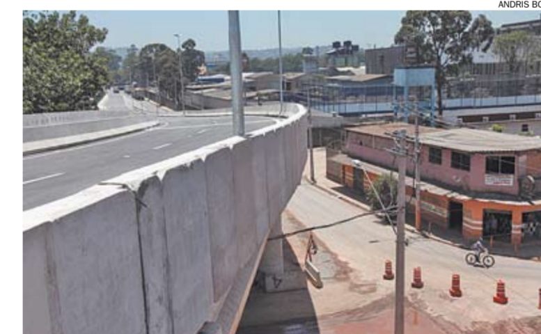
Trecho da fase entregue passa sobre a linha férrea em Capuava