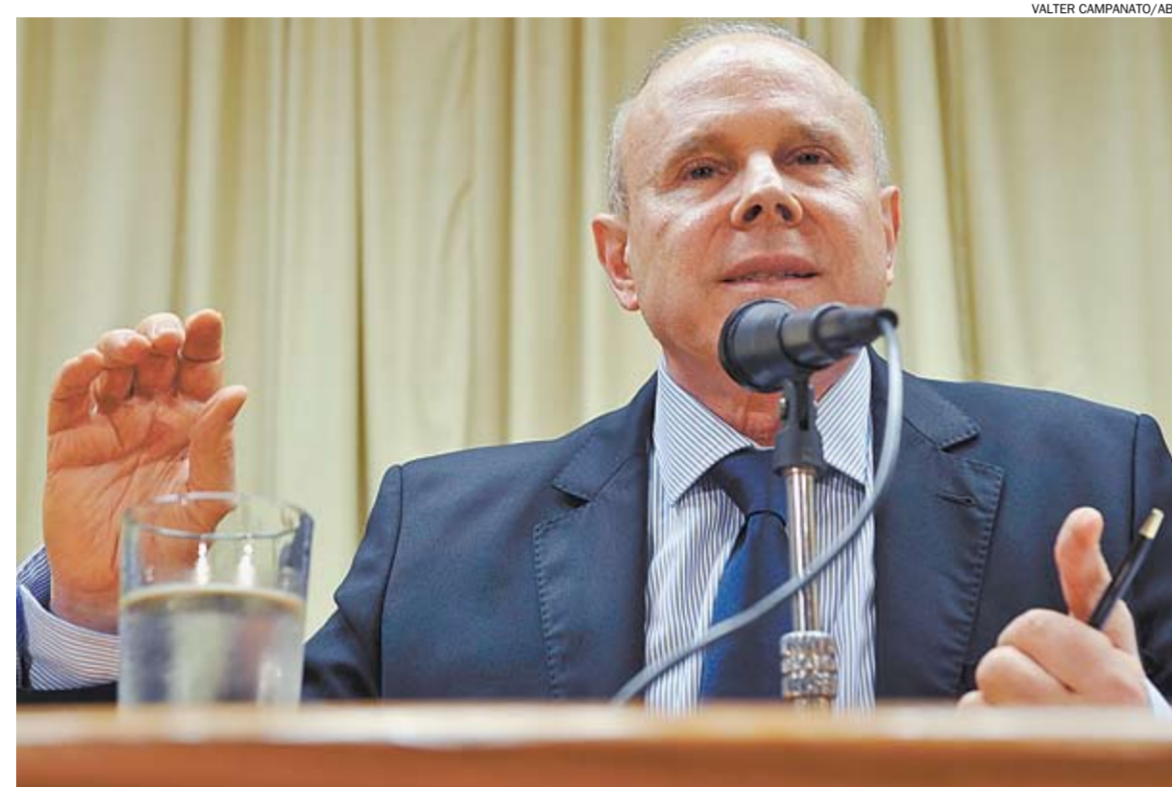
Ministro concedeu entrevista coletiva durante reunião na sede da Confederação Nacional da Indústria

Os dados fazem parte da pesquisa Contas Regionais do Brasil 2010, divulgada nesta sexta pelo IBGE (Instituto Brasileiro de Geografia e Estatística). De acordo com o estudo, no Centro-Oeste também houve aumento da contribuição, passando de 8,8% em 2002, para 9,3% em 2010.