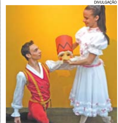
Cena do balé O Quebra-Nozes

A Pinacoteca de São Bernardo (rua Kara, 105, Jardim do Mar) abre neste sábado (24/11), às 16h, a exposição Geração 90: O Que Foi Mostrado – O Que Não Foi Dito . A visitação segue até 31 de janeiro de 2013, de terça a sábado, das 9h às 17h e quinta até às 20h30. Os artistas reunidos nesta exposição iniciaram ou incrementaram sua produção a partir dos anos 90. Nesses vinte anos transcorridos, a evolução de suas obras reforçou o caráter heterogêneo de seus caminhos. Entretanto, eles têm em comum a característica de terem tido uma participação marcante no Núcleo Henfil de Ação Cultural, num dos períodos mais efervescentes das artes visuais em São Bernardo. Esta exposição busca resgatar um pouco do espírito daquele momento entre os anos de 89 e 92 para refletir sobre as razões de sua importância no passado e sobre o que sugerem, instigam e incomodam no presente.