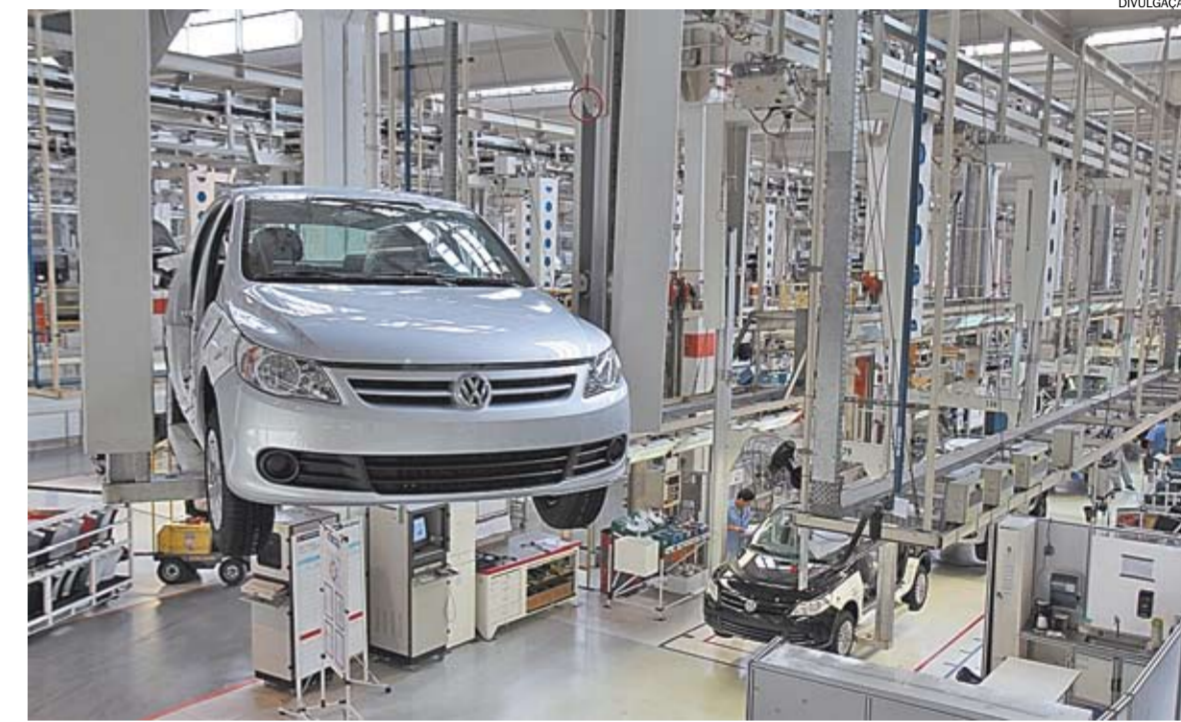
Produção automotiva aquecida estimula setor de serviços na Região, de acordo com economista