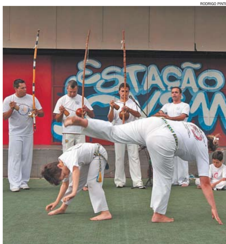
Simpósio de Capoeira chega à terceira edição com programação diversificada

As atividades são gratuitas e livres para todos os públicos. Informações: 4351-3479. ■