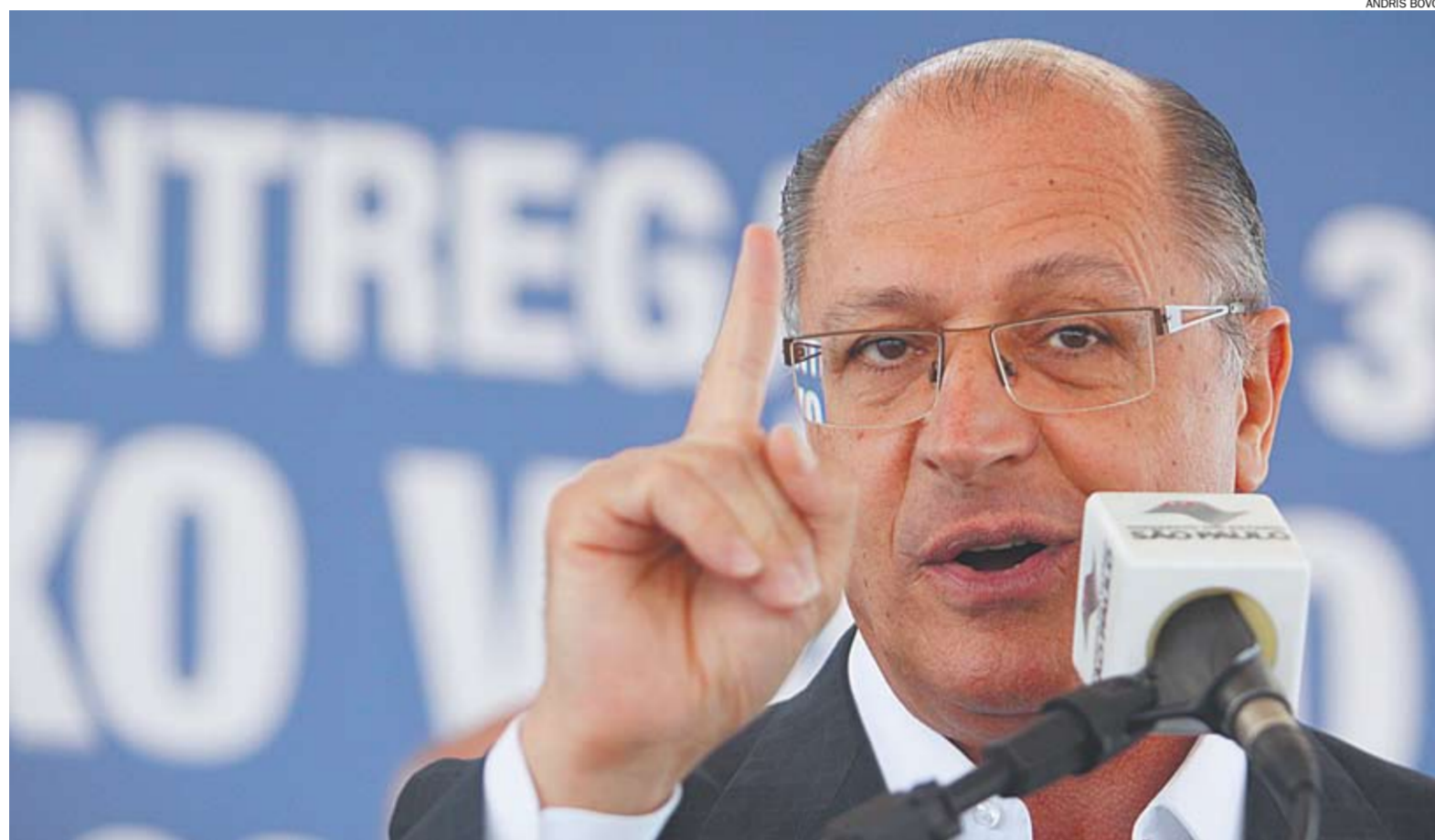
Para o governador Geraldo Alckmin, aprovação na Assembleia Legislativa de lei que oficializa o 'bico' policial garante uma melhor situação aos PMs paulistas

Somente neste mês de novembro, pelo menos 27 mortes foram registradas na Região com a onda de criminalidade. Na noite desta quinta-feira (22/11), em menos de uma hora, duas pessoas foram baleadas em ataques ocorridos no Jardim Irene e na Vila Humaitá,