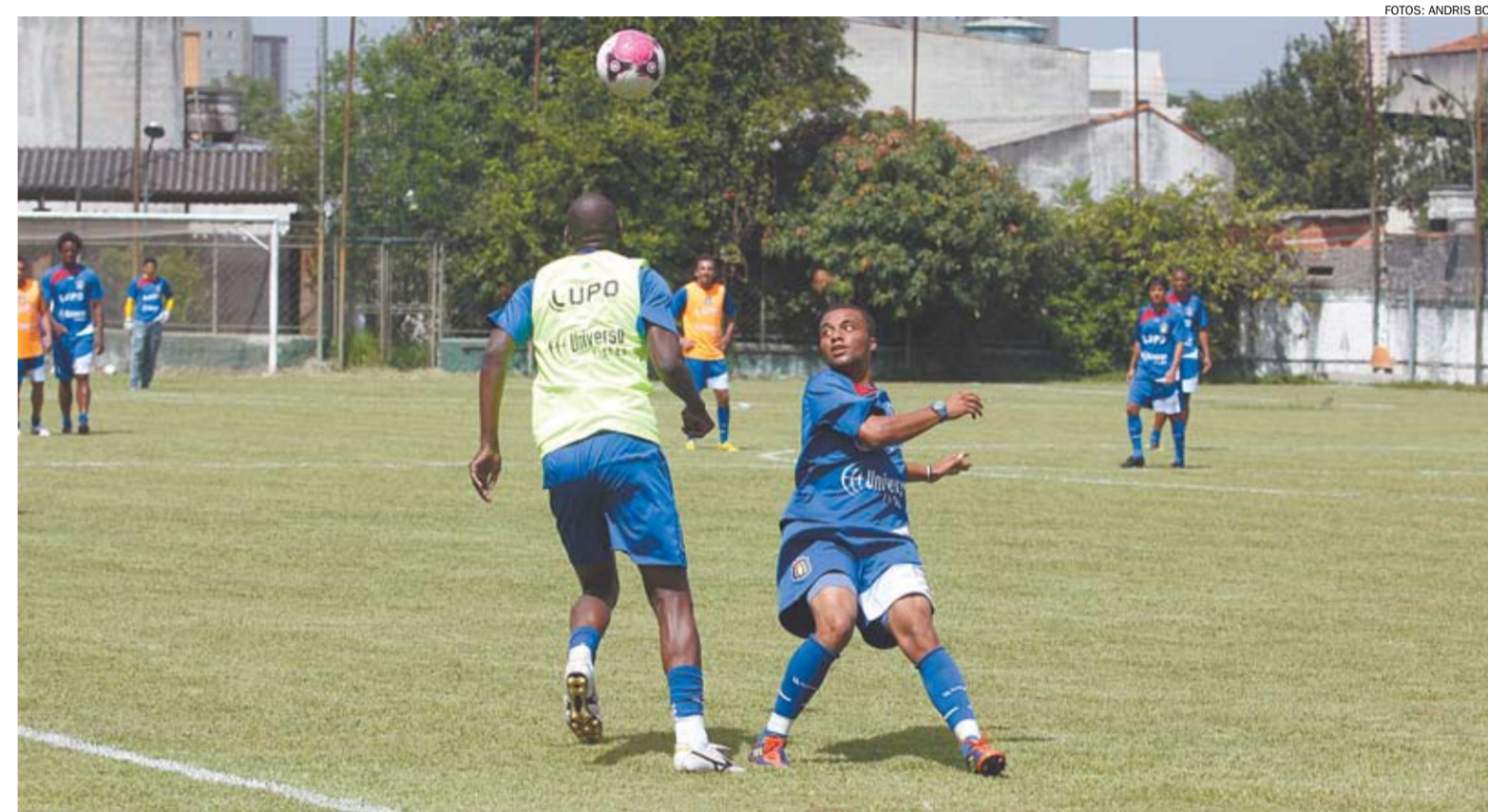
Jogadores se sentiram perseguidos pela arbitragem durante o campeonato e lamentaram por não ter o apoio da torcida nos jogos realizados no Anacleto Campanella