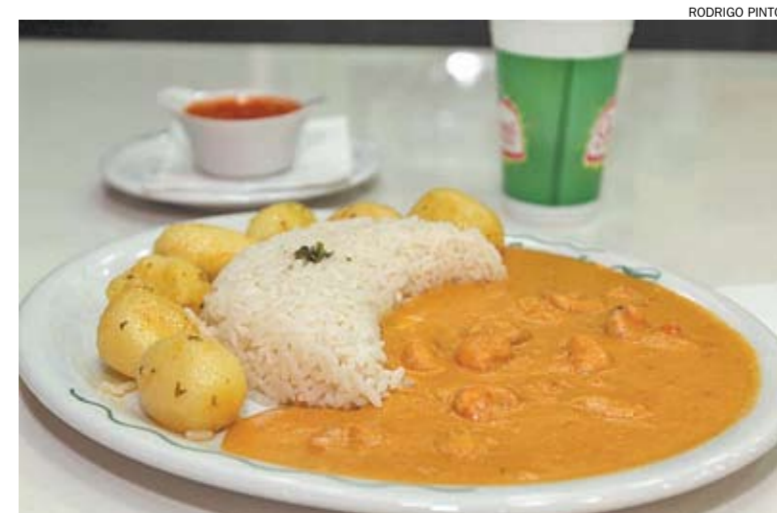
Cliente encontra na Vivenda do Camarão refeições com preços acessíveis

A refeição com mais saída é o Strogonoff de Camarão (R$ 19,90). Outros pratos com preços promocionais são Moqueca de Camarão, Risoto de Baca-