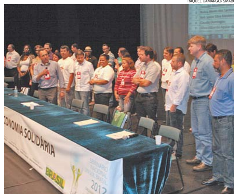
Congresso Unisol realizado no Cenforpe reuniu representantes filiados à entidade

O evento, realizado a cada três anos, reuniu representantes dos cerca de 800 empreendimentos solidários do País filiados à Unisol. Também participaram representantes do governo federal e parceiros de entidades internacionais. ■