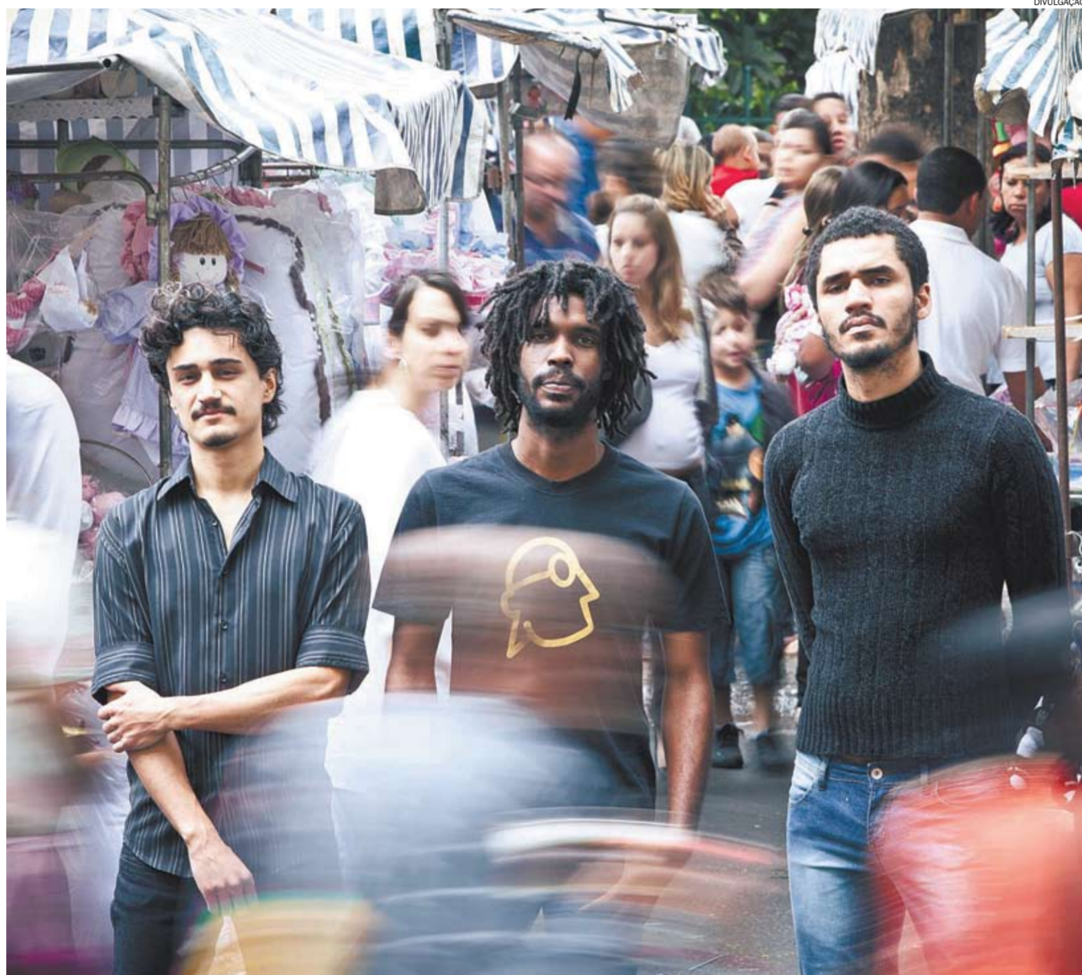
Macaco Bong foi fundada originalmente como um quarteto em 2004 e define seu trabalho instrumental como heavy jazz de Mato Grosso