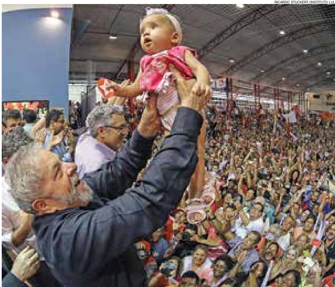
Primeiro ato de campanha petista no segundo turno busca reforçar posição da candidata Dilma no Estado; Lula foi um dos participantes

O discurso da mudança proposto pelo candidato Aécio Neves (PSDB) também foi contestado pelo ex-presidente. “Vivemos duas propostas distintas para o Brasil. Eles vêm vestidos de novo, quando o que trazem é tudo velho. Estes tucanos bicudos que venham nos chamar de corruptos”, desafiou Lula. ■