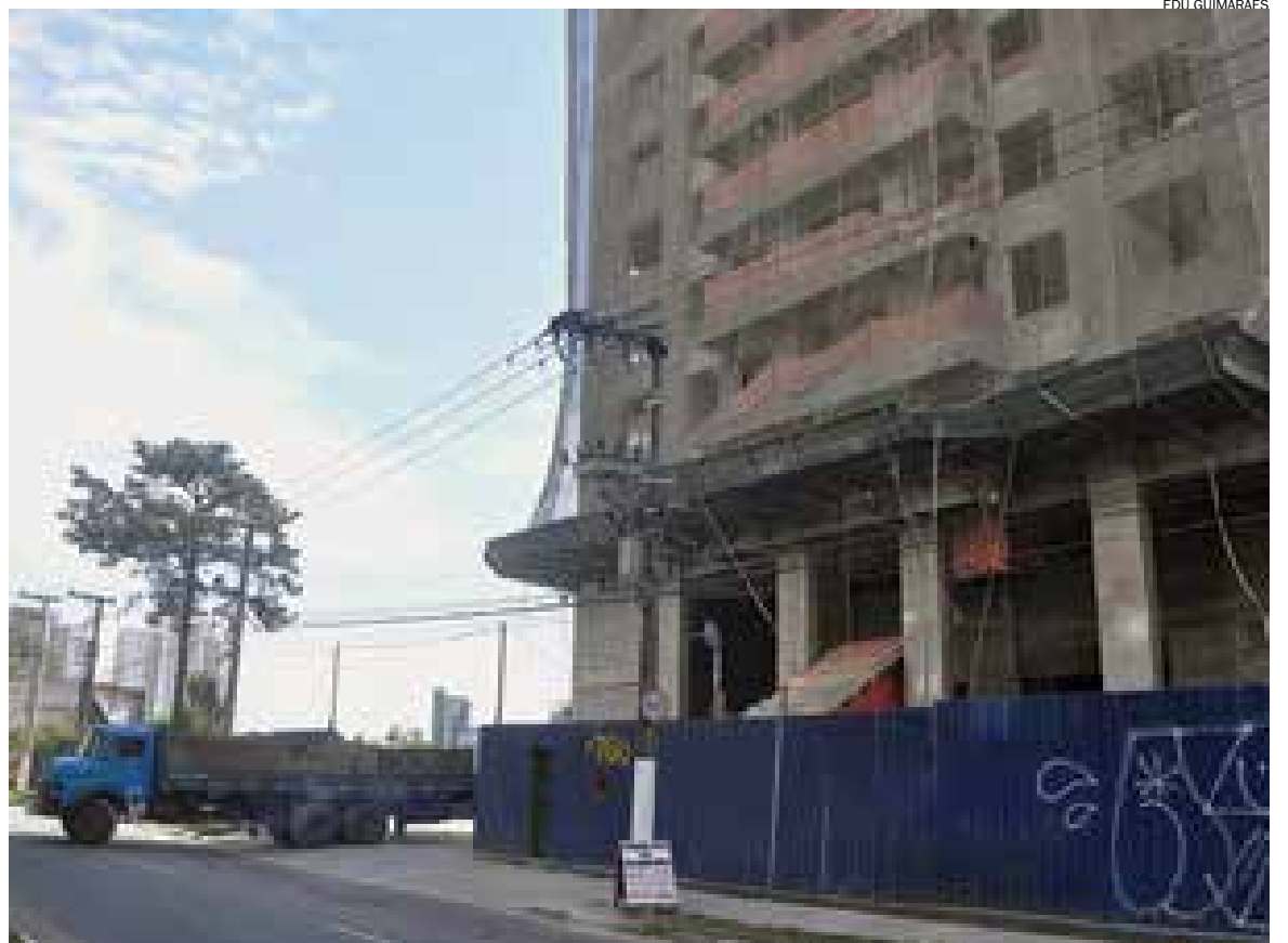
Terreno do número 780 da avenida Industrial, em Santo André, passa pela fase final do processo de descontaminação

O terreno que foi da fábrica de estruturas metálicas Companhia Brasileira Fichet & Schwartz Hautmont por mais de 60 anos está contaminado com chumbo, cobre, zinco, antimônio, cádmio e níquel. Para remediar o local, a Plano & Plano realizou a análise ambiental, relatório de investigação confirmatória para avaliação do real status de contaminação da área, bem como a demolição da construção remanescente dentro da área.