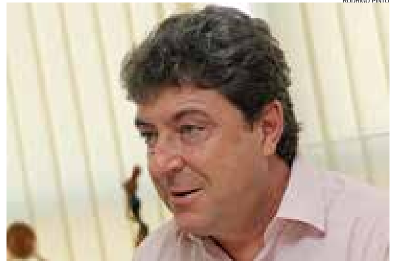
Prefeito de Santo André aposta na participação para escolha administrativa