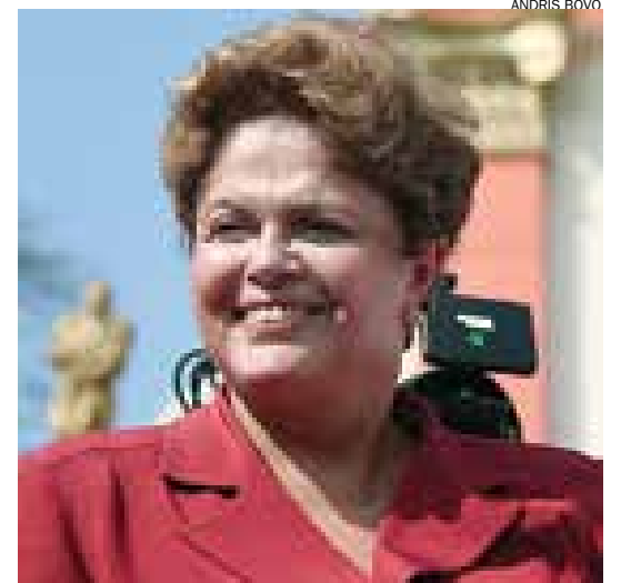
Dilma Rousseff aparece com 42% a 46% das intenções