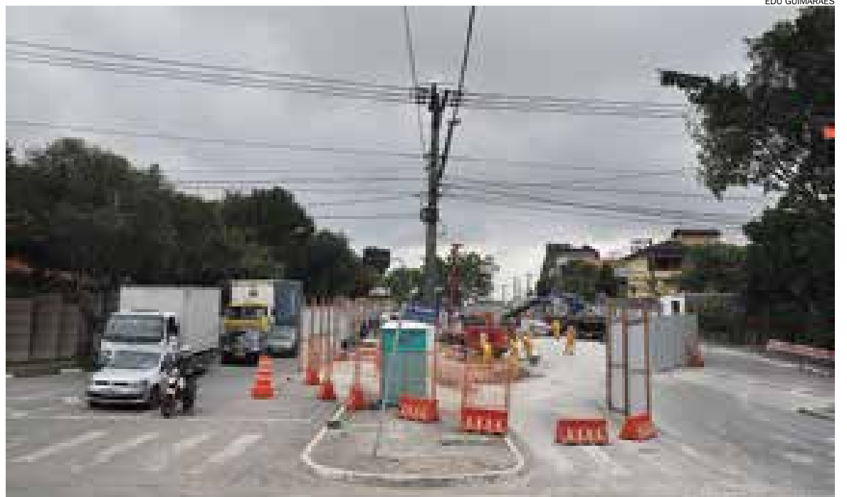
Primeiro viaduto, na avenida José Odorizzi, sobre a Roberto Kennedy, no Bairro Assunção, já está com obras nas vias

Até o fim de outubro, o segundo viaduto, sobre a avenida Humberto de Alencar Castelo Branco, ligando a Samuel Aizemberg à rua dos Flamingos, terá a construção iniciada. A previsão também é de 12 meses de obras. O terceiro irá transpor a praça dos Bombeiros, ligando as avenidas Rotary e Luiz Pequini, e também está previsto para começar a construção até o fim do ano. “Vamos instalar os canteiros de obras com