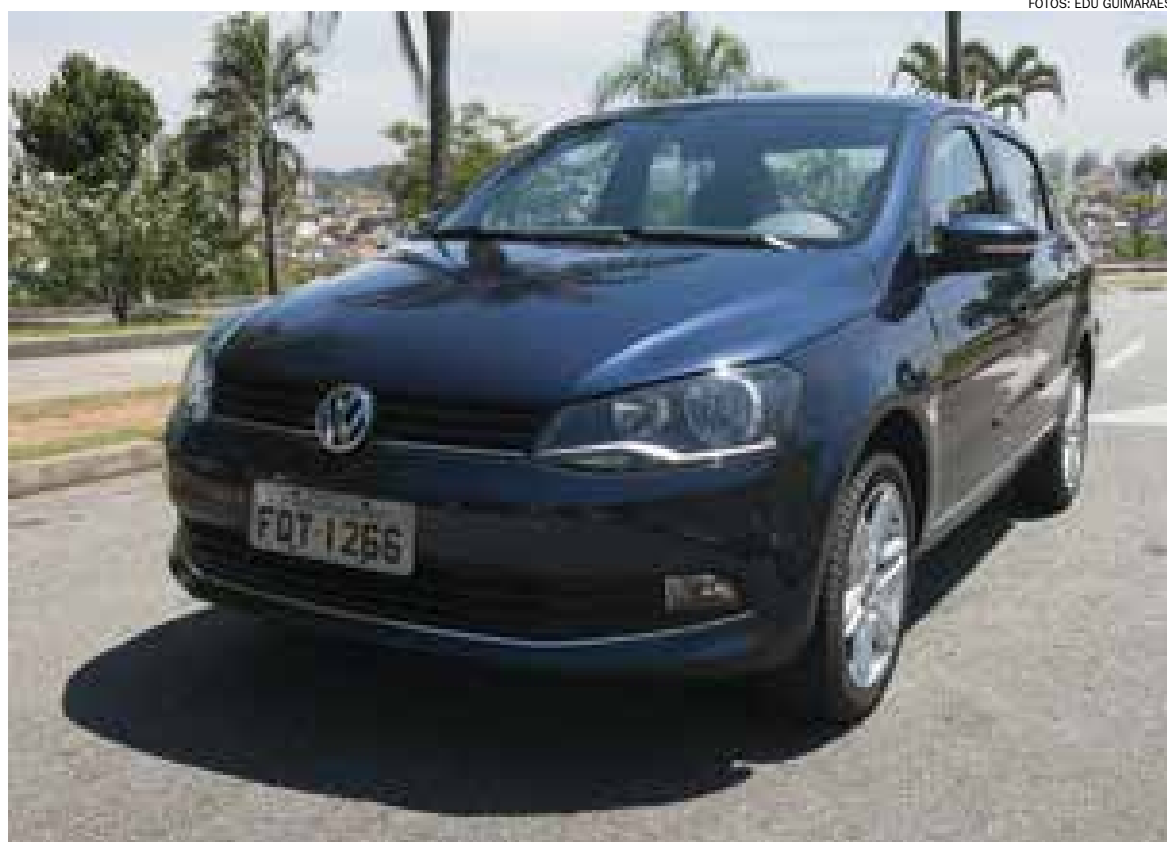
Montadora alemã investiu em um carro com rodas de liga leve de 16 polegadas, em frisos cromados e logotipos exclusivos

O motor 1.6 de 104 cv (com etanol) garante bom desempenho mesmo com carga total, no que é ajudado pela excelente transmissão manual de cinco velocidades, de