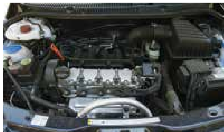
Motor 1.6 de 104 cv (com etanol) garante bom desempenho ao veículo