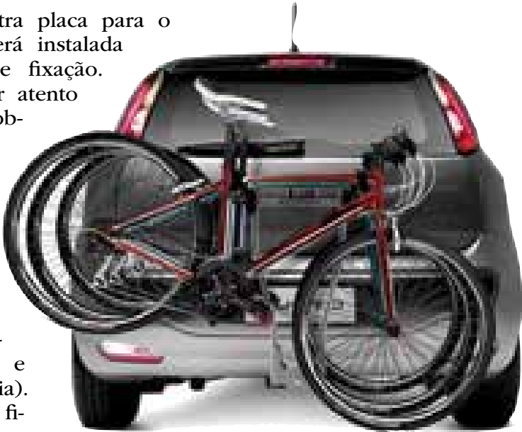
Transporte de bicicletas: atenção para não cobrir a numeração da placa

Já para o transporte das bicicletas na parte superior dos carros, esses cuidados não são necessários, porém o motorista deve ficar atento à altura do transporte.