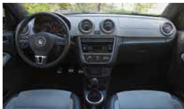
Bancos tem um caprichado revestimento com couro e alcântara que agrada

Existe ainda a versão com o câmbio automatizado, cujo valor de tabela pode chegar a R$ 60.164 no pacote mais completo. Com os mesmos equipamentos, o Polo Sedan sai por R$ 63.126. ■