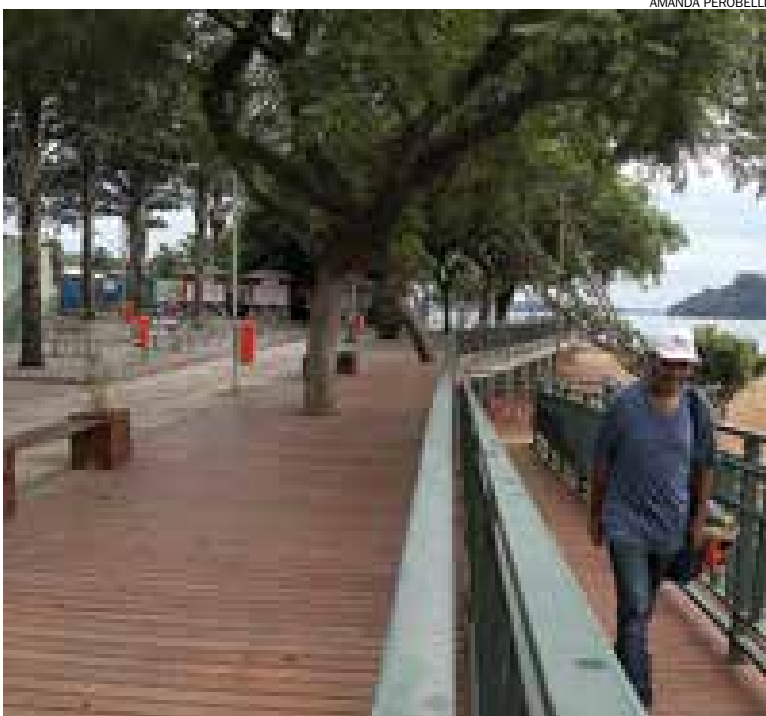
Revitalização da Prainha está entre ações que preparam cidade para o título

frentistas para orientar turistas e revitalizar a Prainha do Riacho Grande. “O próximo passo será qualificar guardas municipais para dar informações turísticas”, projetou Bonisio. As opções de turismo de São Bernardo contemplam desde pontos históricos e religiosos como a Mesquita Abu Bakr Assidik e o Santuário de Nossa Senhora Aparecida – Capela da Record, no Bairro Pauliceia, até lazer e ecologia, com o zoológico do parque do Estoril, onde está o teleférico da cidade, temporariamente inativo para reformas. Pontos culturais, esportivos e a famosa rota gastronômica do peixe e do frango com polenta também são opções para os turistas. ■