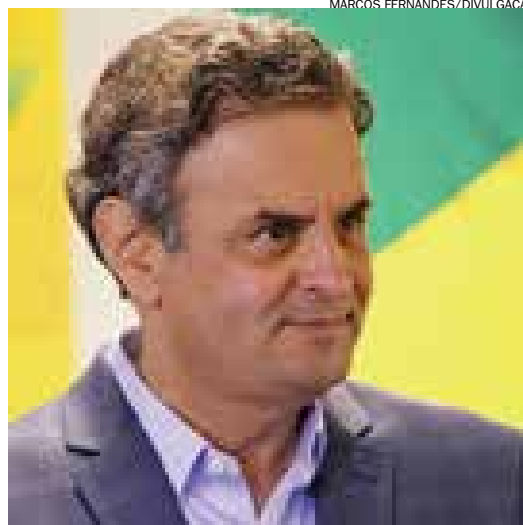
Aécio Neves aparece com 44% a 48% das intenções

No primeiro turno, Dilma teve 41,59% dos votos válidos e Aécio, 33,55%.■