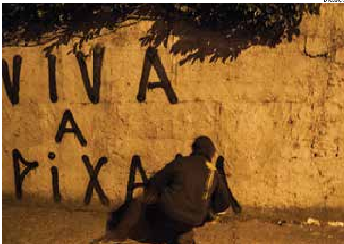
As gravações de PixoAção 2 foram feitas em São Paulo e mostram ações de quem arrisca a vida para deixar sua marca nos muros

Foram três anos de trabalho até o documentário de 80 minutos ficar pronto. As gravações foram todas feitas em São Paulo e, para colaborar na indagação sobre o teor artístico da pichação, o sociólogo Edu Zambetti afirmou que “Pixo é aquele grito em forma de