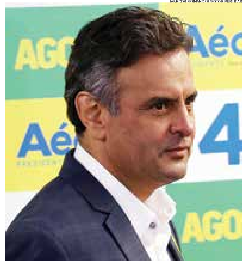
Candidato tucano estava na frente, mas agora tem poucos dias para buscar virada

De acordo com o levantamento do Datafolha, se contabilizados os votos totais, Dilma tem 48% e Aécio 42% das intenções de voto;