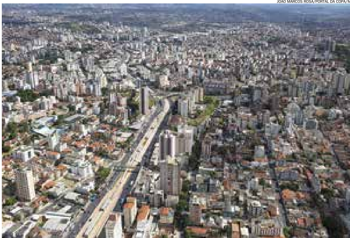
Minas Gerais possui déficit habitacional de 557 mil unidades; na foto, vista aérea de Belo Horizonte

Em contraste à proporção de investimentos estaduais dados à Habitação, um estudo realizado pela FJP (Fundação João Pinheiro) e pelo Ministério das Cidades em 2010, divulgado em 2013, apontou que Minas Gerais apresentava déficit habitacional de 557 mil residências.