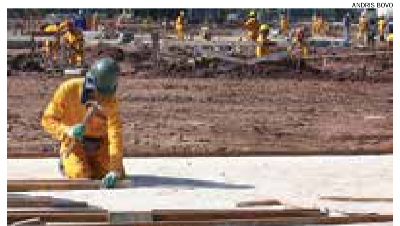
População ocupada ficou em 23,1 milhões de pessoas, de acordo com a pesquisa

Já a população ocupada ficou em 23,1 milhões de pessoas, o que significa que, apesar da queda da taxa de desemprego, não houve geração de postos de trabalho tanto na comparação com agosto deste ano quanto em relação a setembro do ano passado.