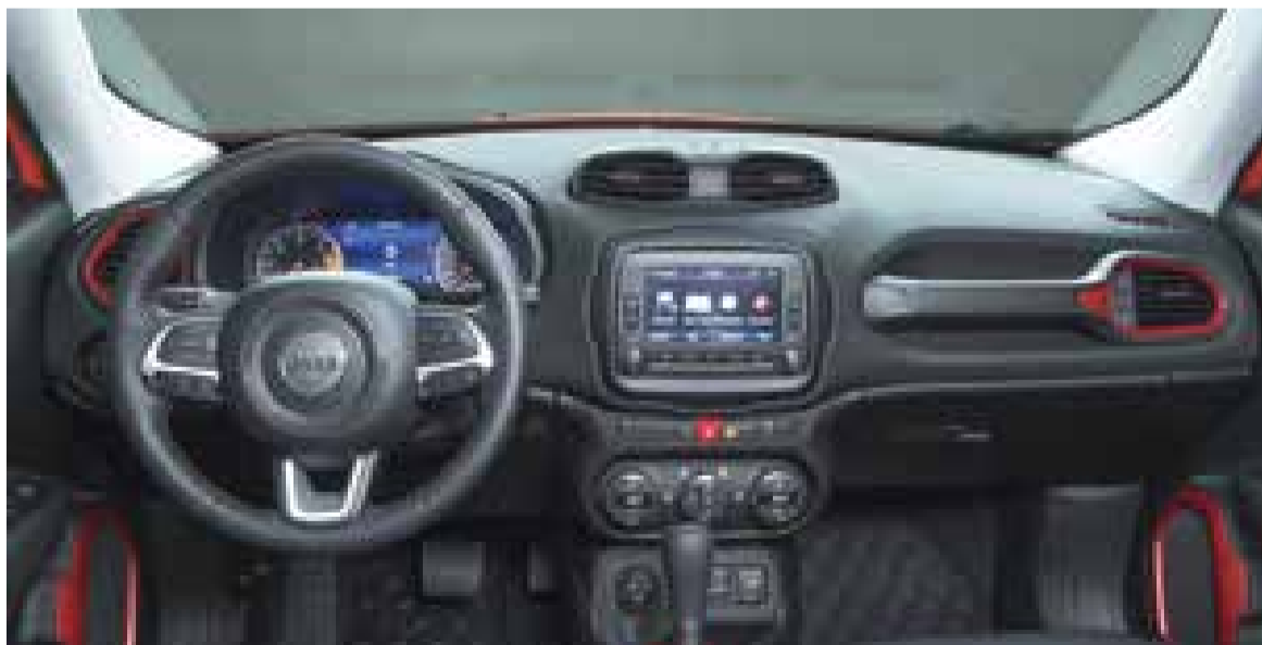
Painel segue tendência da marca com pouca ousadia nas linhas e acabamento de boa qualidade

A mesma filosofia de aventureiro urbano também é aplicada ao interior do modelo. Ainda sem divulgação da lista de equipamentos e da tabela de preços, é de se esperar um pacote de equipamentos condizente com a categoria, com ar-condicionado, rádio com conectividade bluetooth e mais airbags do que os obri-