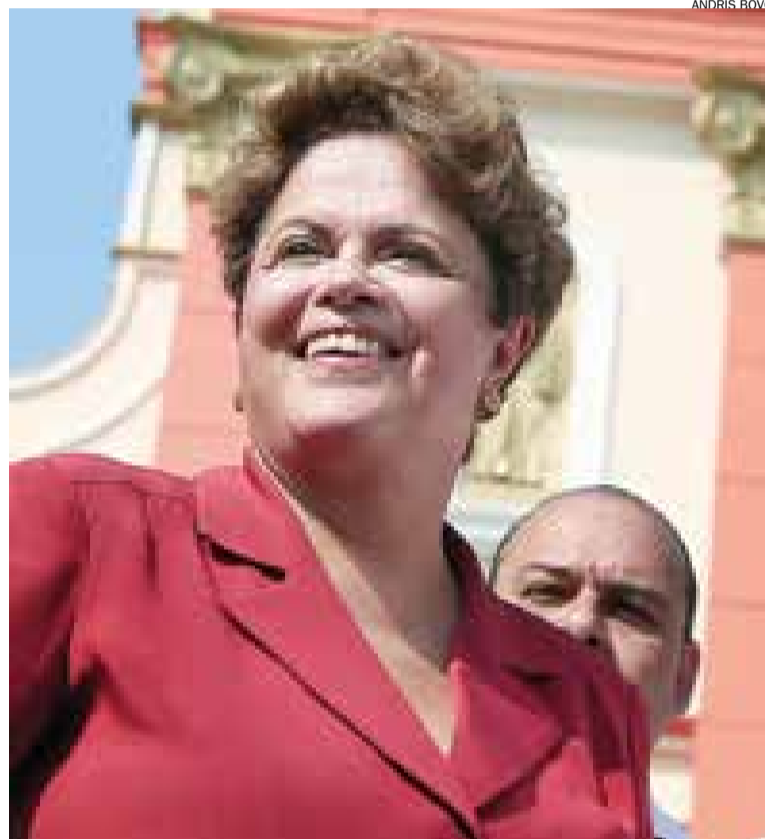
Dilma e PT conseguem criar "onda vermelha" com atos de rua pelo Brasil

A vantagem de Dilma é mais expressiva se contabilizados os votos totais, aponta o levantamento do Ibope, onde a presidente aparece com 49% dos votos contra 41% de Aécio; 7% são de brancos e nulos e 3% de indecisos.