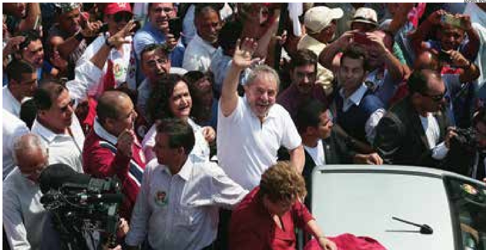
Ex-presidente Lula em carreta pelas ruas de São Bernardo durante o primeiro turno reuniu mais de 1,5 mil pessoas; evento encerra campanha de Dilma

Lula tradicionalmente encerra as atividades de campanha em São Bernardo. Durante o primeiro turno, Lula percorreu a Marechal ao lado de 1,5 mil militantes, quando criticou a "agressividade" da mídia contra Dilma. Esta será a quarta vez que