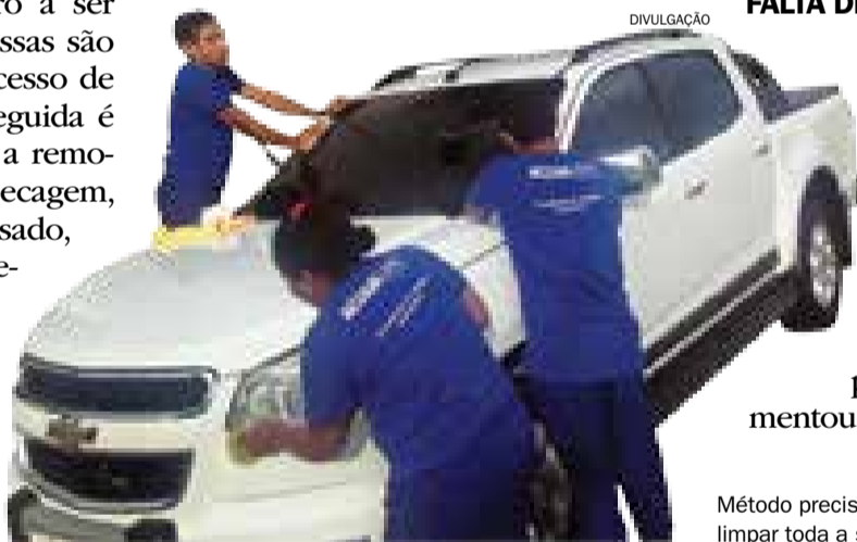
Método precisa de apenas 300 ml de água para limpar toda a superfície do carro

Com o problema da falta de água, principalmente no estado de São Paulo, o número de empresas que prestam o serviço de lavagem a seco e o número de lavagens vem aumentando. Na AcquaZero a procura pela limpeza a seco aumentou 30% nos últimos meses. ■