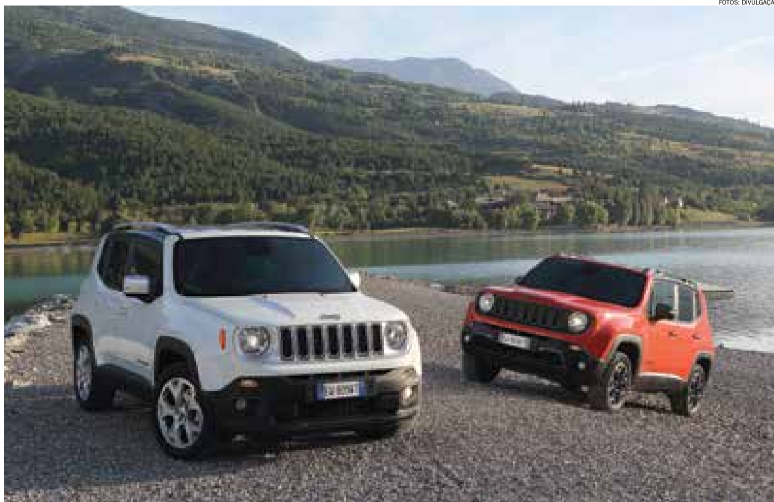
O Renegade brasileiro chega com apelo mais urbano para concorrer com o Ford EcoSport e Renault Duster

O principal diferencial em relação aos compactos de outras marcas será a versão mais cara do modelo, que promete não decepcionar os que esperam no Renegade a