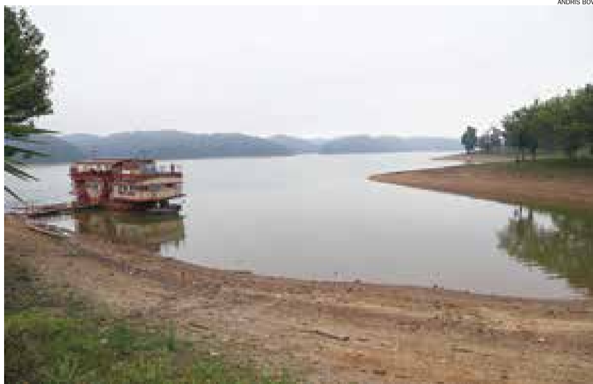
Recuo da represa Billings é visível e margens apresentam faixa de terra que antes ficava coberta pela água

O problema, conforme Santos, é que o braço Rio Grande é o menor dos reservatórios do Estado e não tem capacidade para atender a demanda da grande metrópole. “Efeito dominó. Com Cantareira e Alto Tietê secando, será uma questão de meses para que não tenha mais água no Rio Grande. A situação não vai ser diferente se não mudarem a política da Sabesp”, citou. Para o presidente, o governo estadual deveria anunciar racionamento, antes que a situação fique pior. “Mas, por uma questão eleitoral, o rodízio foi evitado”, criticou.