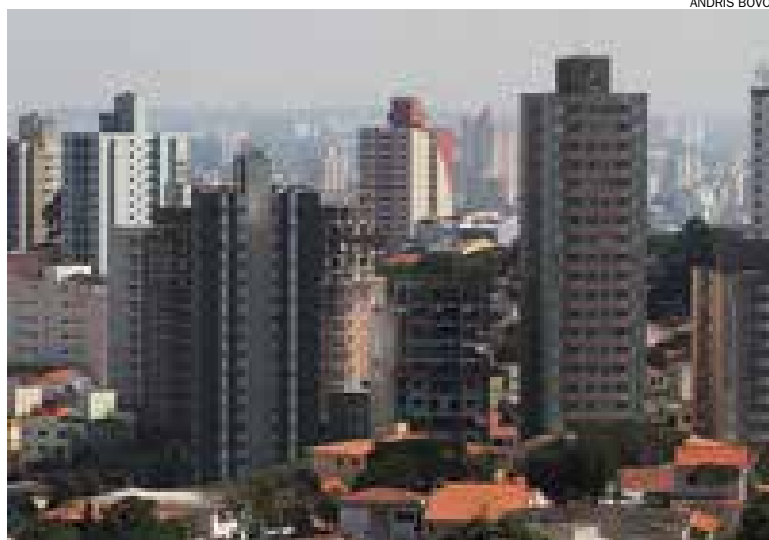
Salão terá duas mil oportunidades e opção do programa Minha Casa Minha Vida

O Sindicato dos Metalúrgicos do ABC e a Plaza Realty Brasil realizam neste final de semana o 1º Salão Imobiliário dos Metalúrgicos com descontos especiais para os associados da entidade. O evento será realizado no sábado, 28 de fevereiro, e domingo, 1º de março, das 8h às 18h, no terceiro andar da Sede do Sindicato, rua João Basso, 231.