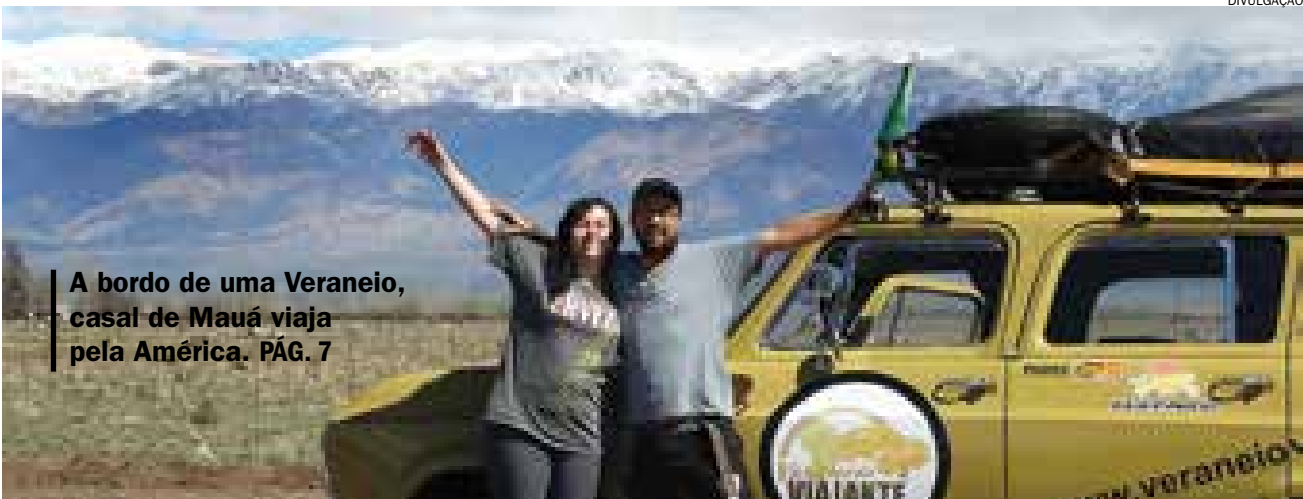
A bordo de uma Veraneio, casal de Mauá viaja pela América. PÁG. 7