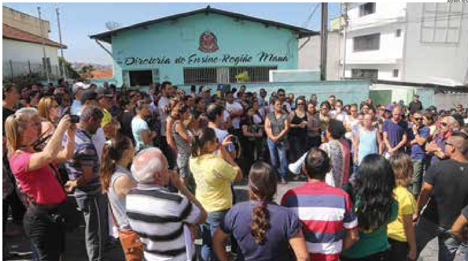
Segundo protesto reuniu cerca de 100 mães e pais de alunos contra o fim do transporte para alunos maiores de 12 anos promovido pelo governo do Estado