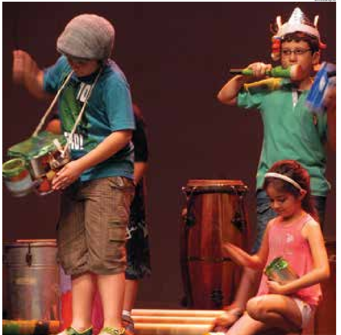
A coordenação da Emia ressalta que não se trata de uma escola de formação de artistas, mas um espaço para experimentação