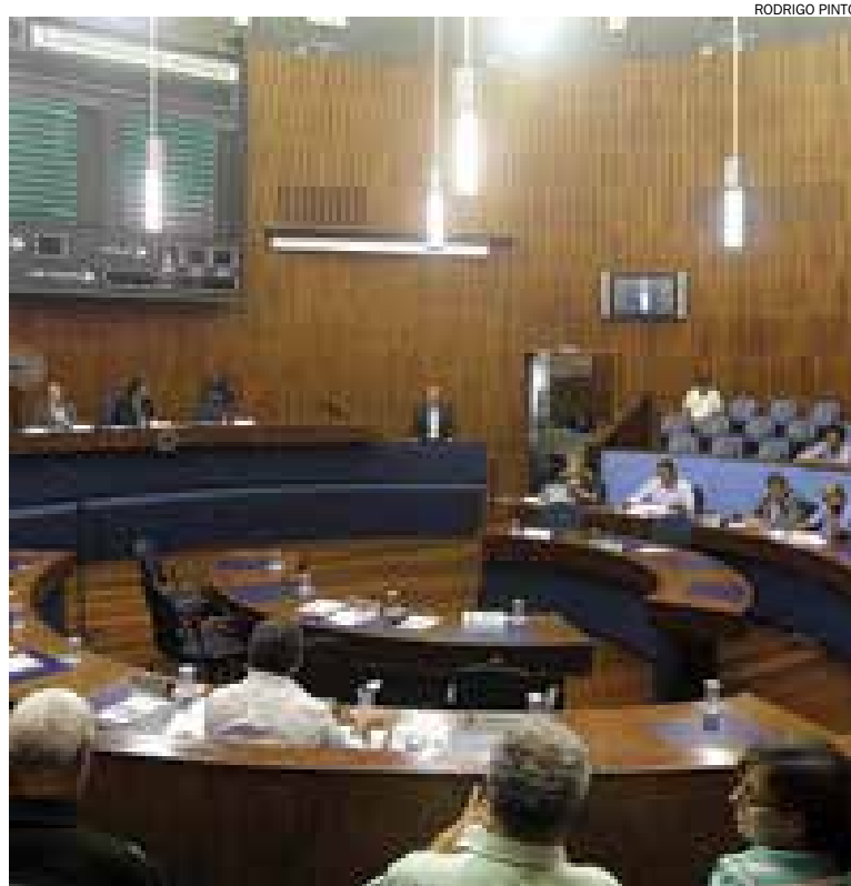
Oposição resolveu endurecer e já se articula para as eleições municipais de 2016

Entre os projetos travados pelo Legislativo está o empréstimo de R$ 12 milhões junto à Caixa Econômica Federal para pavimentar o bairro Recreio da Borda do Campo. Os vereadores exi-