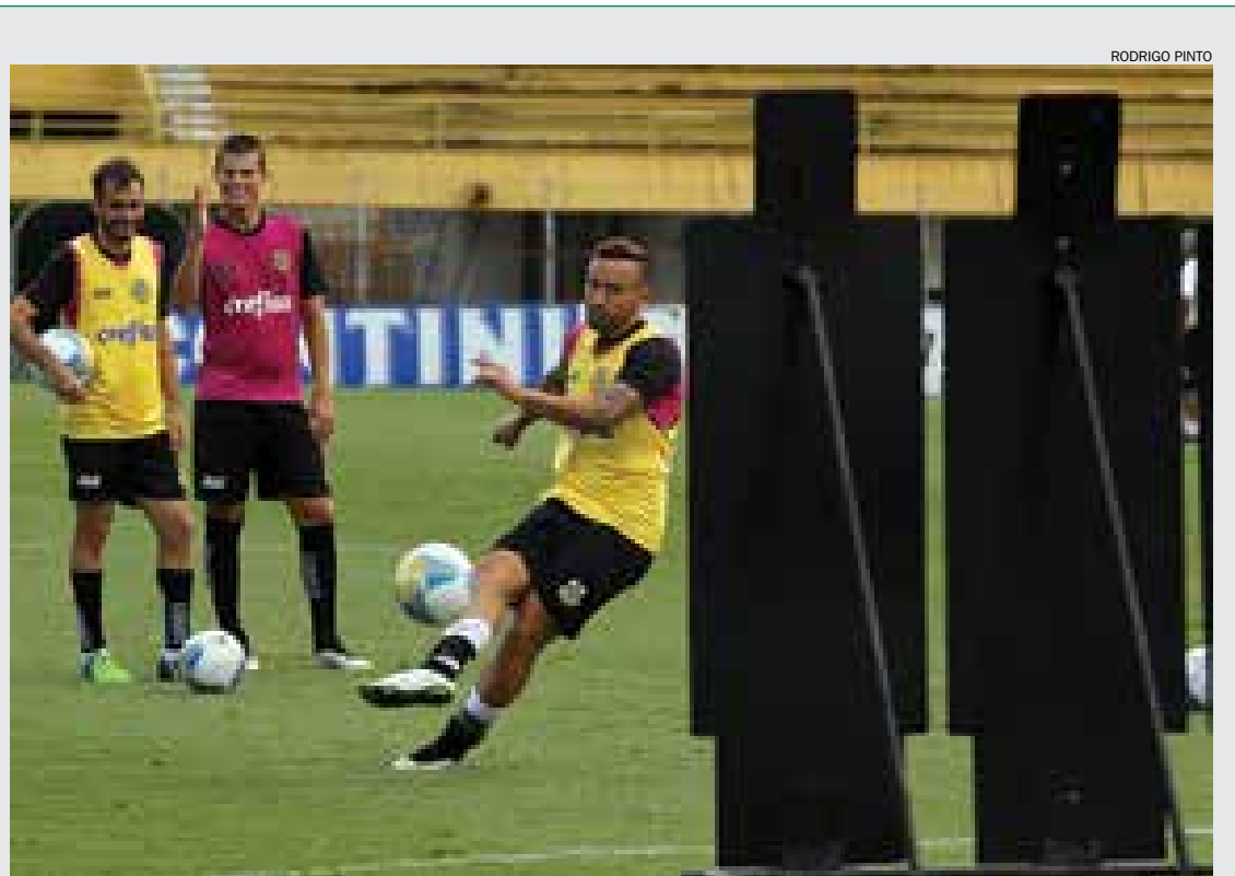
São Bernardo não está desesperado com situação na tabela e aposta na recuperação no Campeonato Paulista

Já a Copa Santo André começa no sábado com jogos em oito campos e sem chances para vacilos, afinal uma derrota é fatal. ■