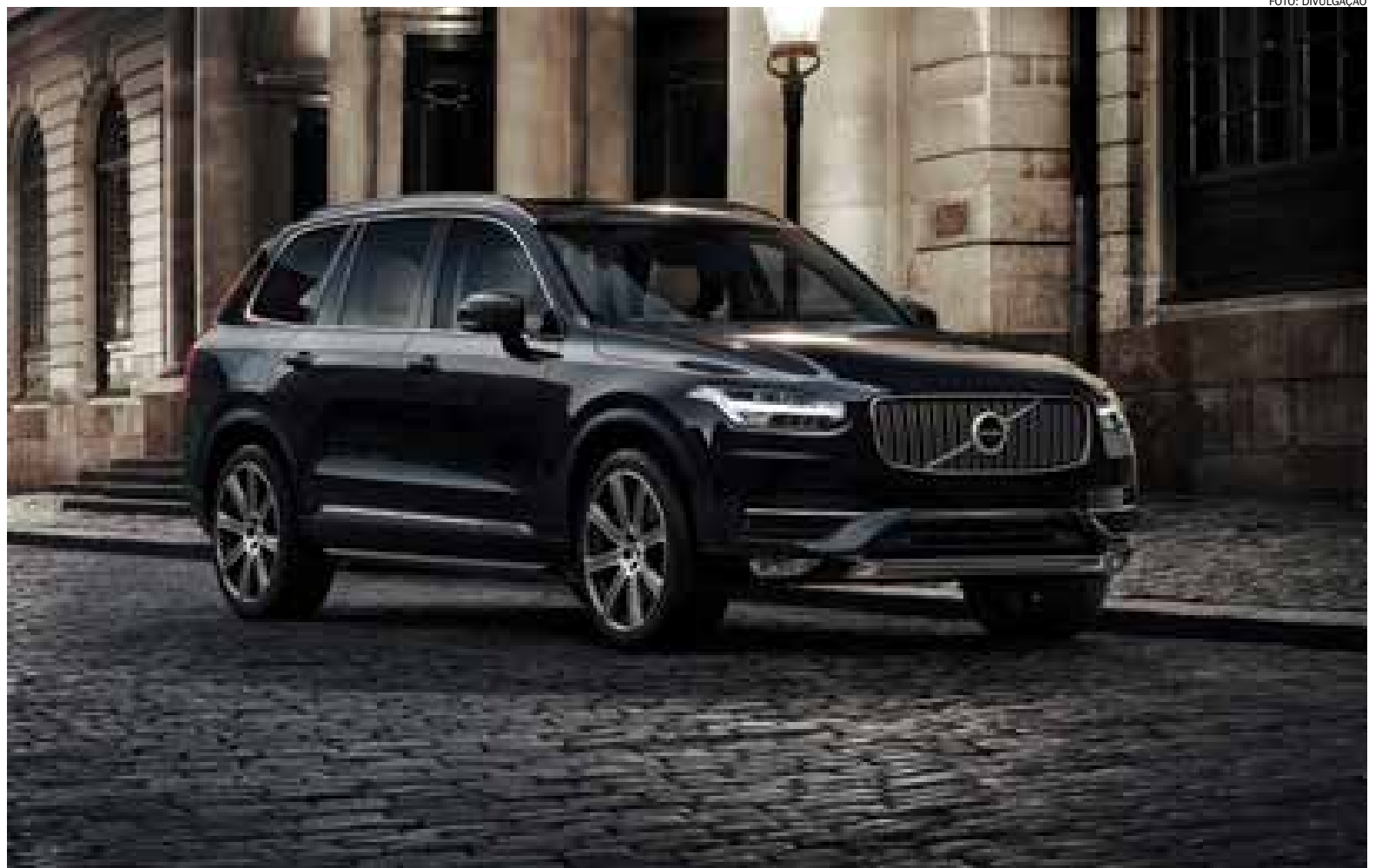
SUV de luxo XC90 foi o modelo selecionado pela montadora Volvo para fazer o teste nas ruas da cidade de Gotemburgo, na Suécia; risco de acidente existe, mas é pequeno

Apesar da tecnologia já existir, uma série de barreiras explica o prazo de dois anos para os primeiros testes. Um destes é a dificuldade de se calibrar os