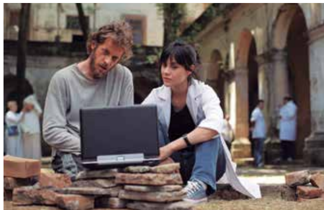
Menos que Nada