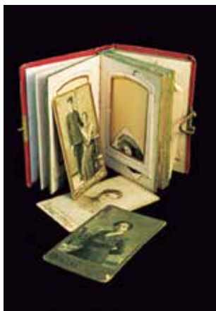
Palestra História de Vida