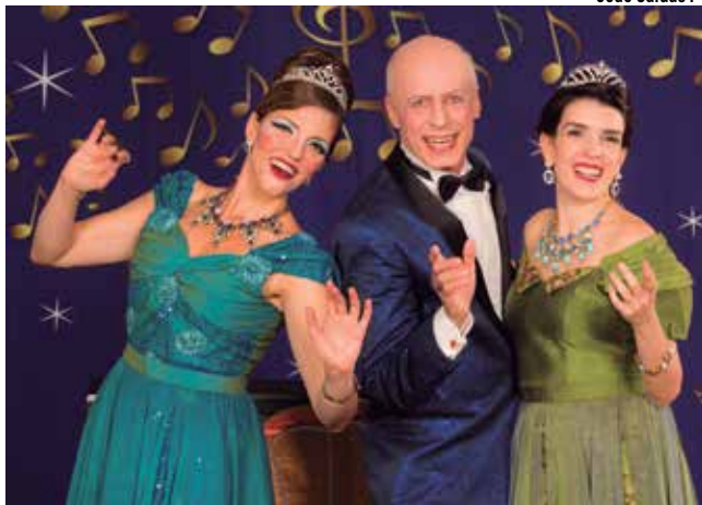
Nas Ondas do Rádio