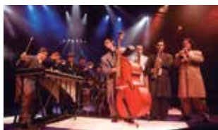
Guga e Heartbreakers

Saguão do Teatro Municipal • Praça IV Centenário, s/n Centro