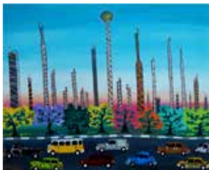
Cartão Postal, de Enzo Ferrara

Exposição de intervenções do coletivo Casa da Vez, formado