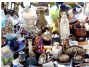
Feira de antiguidade