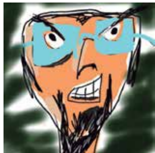
Oficina de Desenho e Ilustração