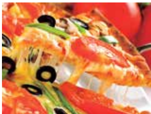
Pizzas da Nona

Parque Regional Avenida Itamarati, 536 Parque Jaçatuba