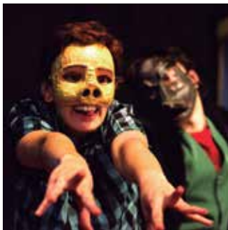
Os Três Porquinhos