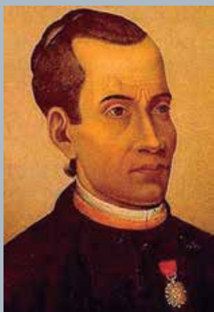
José Maurício Nunes Garcia