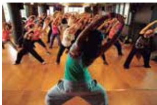
Oficina de dança