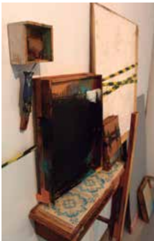
Casa da Vez