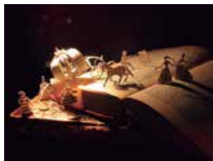
Palestra Contos de Fadas