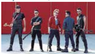
Banda Mercúrio Cromo