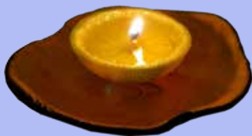
Oficina de luminária de frutas