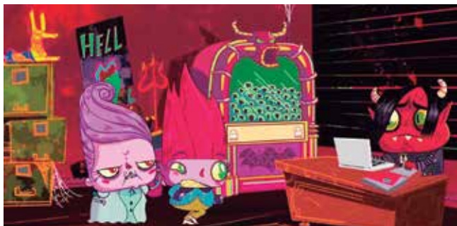
Historietas Assombradas para Crianças Mal Criadas

Direção Cecílio Neto, Brasil, 2000, 82 minutos No começo dos anos 1960, três meninos, Joaquim, Zezo e Pelé, começam a achar que talvez tenham o poder de invocar o demônio para conseguir coisas. Em meio a trapalhadas e des-