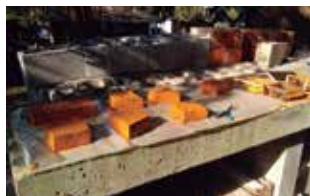
Oficina de confecção de tijolos

CPFP Valdemar Mattei Av. Artur de Queirós, 399 Casa Branca