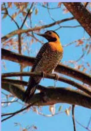
Pássaro no Parque Central

Planetas, estrelas, constelações são alguns dos corpos celestes que poderão ser