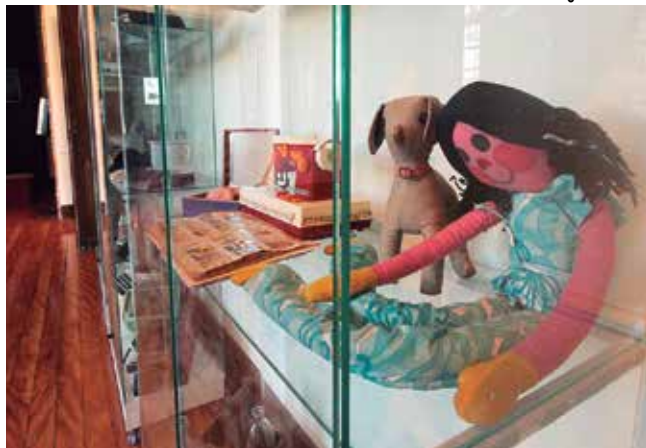
Vitrine do Mês - Criança Brincando com o Tempo