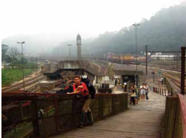
Vila de Paranapiacaba