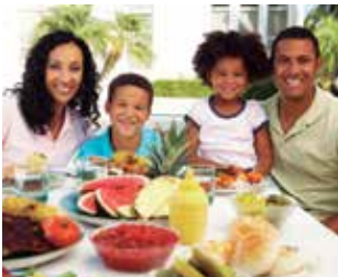
Palestra alimentação saudável