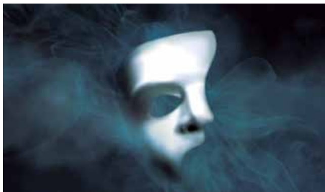
Palestra A História da Ópera