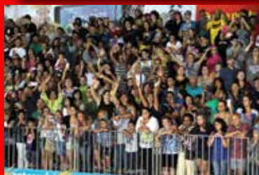
CARNAVAL 2016 - CAIA NA FOLIA