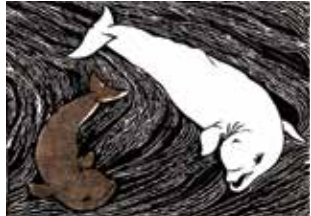
Obras da exposição Santuário