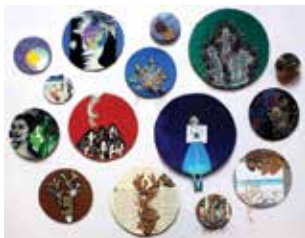
Obra de Júlia Mazzotti