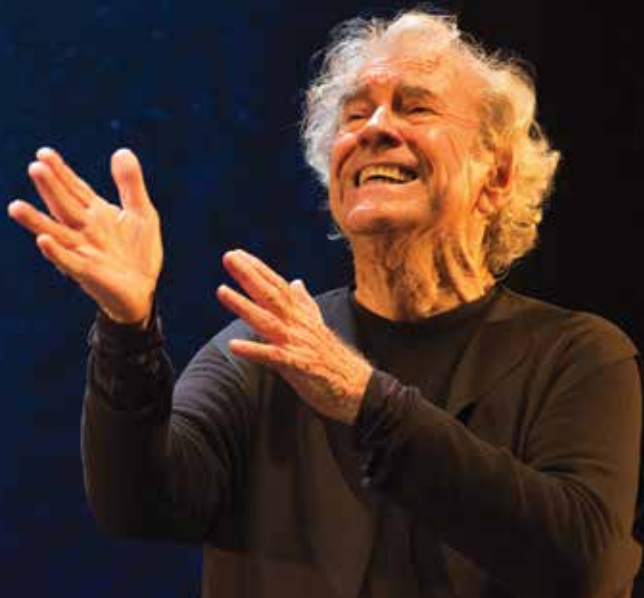
Juca de Oliveira em Rei Lear