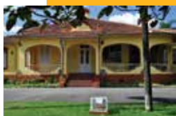
INSCRIÇÕES PARA CURSOS NA EMIA