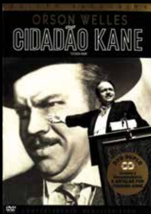
Filme Cidadão Kane

XIX. A família Amberson se revela relutante em acompanhar as transformações que a rodeiam. Uma mulher desperdiça a vida ao deixar de se casar com a grande paixão por dois motivos: o primeiro foi em razão de uma serenata na qual houve um pequeno acidente, que fez com que ela se sentisse ridícula e acabasse se casando com um homem que não amava. O segundo foi a interferência do único filho na vida da mãe. Quando este homem, agora viúvo assim