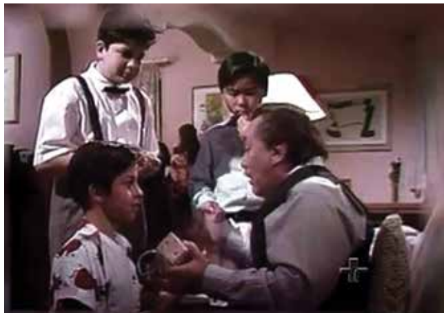
Documentário Diário de Bordo de uma Viagem à Infância

Concha Praça do Carmo Praça do Carmo, s/n Centro