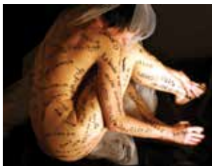
Obra de Anna Donadio