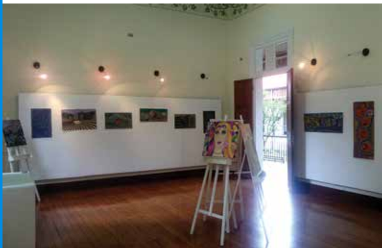
Exposição Os Cem Molduras