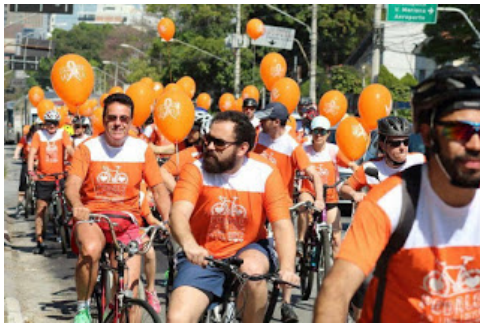
Pedalada em Santo André está na quarta edição

Par esta edição há 2 mil pessoas inscritas. Interessados podem doar 1 kg de alimento não perecível no local.