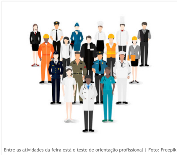
Entre as atividades da feira está o teste de orientação profissional

A escolha da profissão sempre foi um tema delicado para os jovens. Para auxiliar nesta decisão, a Arte & Manha Marketing Educacional organiza mais uma Feira de Profissões gratuita e aberta ao público, neste sábado (1º), das 10h às 15h, no Colégio São Carlos , em São Bernardo do Campo (Rua Comendador Pinotti Gamba, 119, Rudge Ramos).