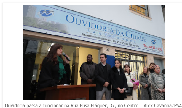
Ouvidoria passa a funcionar na Rua Elisa Fláquer, 37, no Centro

Há pouco mais de um mês atendendo ao público em novo endereço, a Ouvidoria de Santo André teve, nesta última segunda-feira (27), a abertura oficial da nova sede. A mudança para o prédio, localizado na Rua Elisa Fláquer, 37, no Centro, teve como objetivo diminuir despesas e facilitar o acesso dos munícipes ao órgão, que agora fica mais próximo aos locais de atendimento que funcionam no Paço Municipal e no Serviço Municipal de Saneamento Ambiental de Santo André (Semasa).