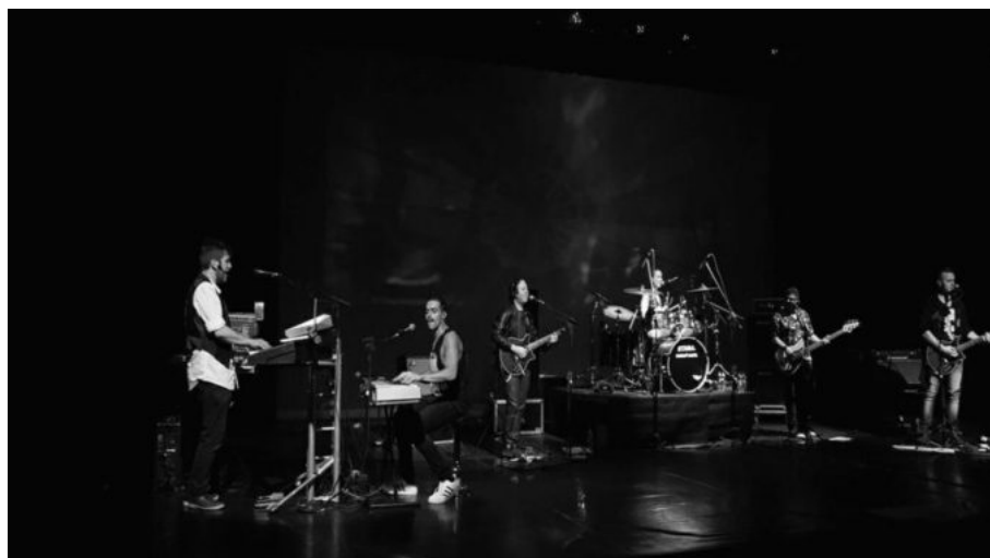
Tributo à banda britânica, abre a programação do fim de semana no Teatro Municipal.

Programação terá ainda festival de rock, exibição de documentário de Eduardo Coutinho e roda de cantoria dedicada às mulheres, entre outras atrações