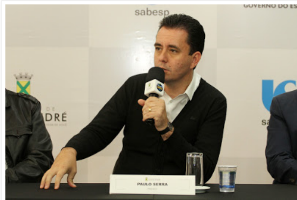
Prefeito fará anúncio amanhã para a imprensa; valor será usado para ações em diversas áreas

A maior parte do montante deve ser destinado para a segunda etapa do programa QualiSaúde, iniciativa do Executivo para modernizar o sistema de saúde da cidade.