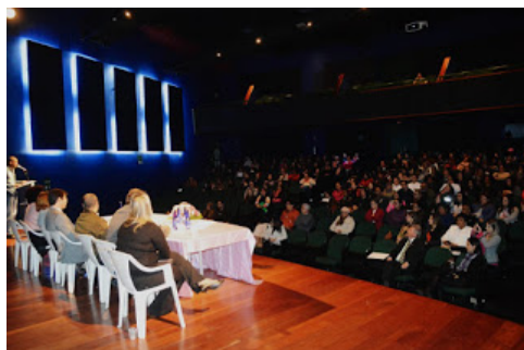
A palestra e campanha "Entrega Responsável é Legal" têm como objetivo informar e orientar a mulher e a sociedade civil de que a entrega para adoção não é um crime e está prevista em lei

O Teatro Municipal de Mauá sediou uma capacitação voltada aos funcionários da Saúde e da Promoção Social, nesta última quinta-feira (5), sobre a campanha "Entrega Responsável é Legal". Trata-se de uma conscientização sobre o direito de uma mulher gestante ou parturiente entregar o filho para adoção, se desejar e, com isso, ela deve ser acolhida e amparada, sem pré-julgamentos ou preconceitos dentro do sistema de Justiça.