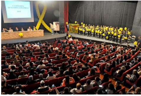
Fórum ocorreu na última sexta-feira (6), mas programação do Setembro Amarelo vai até o fim do mês

No ano de 2017, o município registrou 43 suicídios, sendo que destes 31 vítimas eram do gênero masculino. Dos 19 suicídios registrados em 2018, 13 vítimas eram do gênero masculino. Os números de tentativas são ainda mais alarmantes, das 751 tentativas de suicídios registradas nos últimos dois anos, 518 vítimas são do gênero feminino.