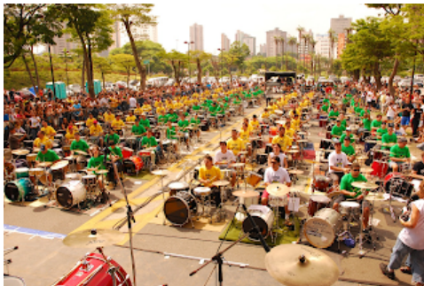
Probabilidade de chuva, em 21 de setembro, foi o motivo da transferência do local do evento

O Rock Beat Show ocorre em 21 de setembro em novo endereço. Diante da possibilidade de chuva nesta data, o evento foi transferido do São Paulo Expo, onde acontecerá a Music Show Exp , para o Ginásio Pedro Dell'Antônia, em Santo André, para garantir a sua realização. Na ocasião, mais de 1,5 mil músicos devem se reunir, pela primeira vez, na América Latina em um grande show gratuito, com o objetivo de chamar a atenção da sociedade sobre a importância do ensino musical e da música na vida das pessoas.