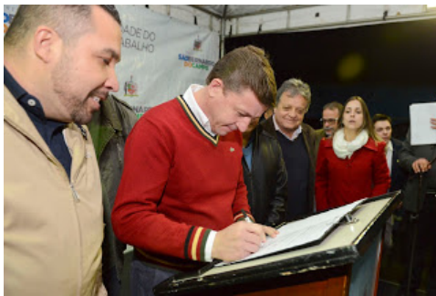
Morando assinou ontem (5) a autorização para a reforma, que deve durar 90 dias

O prefeito de São Bernardo do Campo, Orlando Morando, autorizou o início das obras de reforma e ampliação do Centro de Referência de Assistência Social, localizado no bairro Alves Dias (Cras 2), nesta última quinta-feira (05). Responsável por atender 7.274 famílias em vulnerabilidade social, o equipamento passará por ampla intervenção, nos próximos meses, para melhorias no atendimento do espaço.