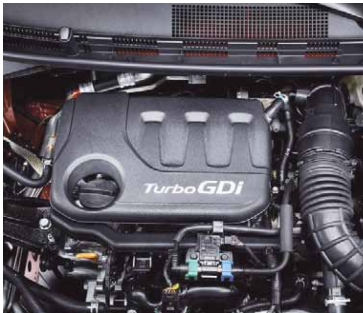
Motor oferece torque máximo em baixas rotações; painel de instrumentos ganhou velocímetro digital e conta-giros analógico

As demais versões do novo HB20 trazem como opções os motores flex 1.0 12V de três cilindros ou 1.6 16V de quatro cilindros, agora com