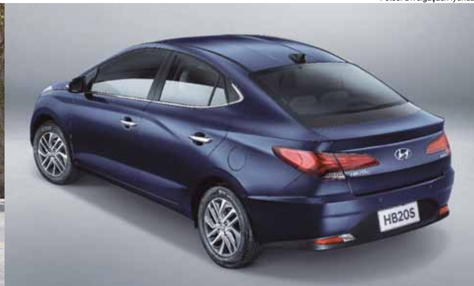
Dianteira do HB20 herda visual polêmico do sedã Sonata, que dividiu opiniões; traseira do sedã ganhou ares de “fastback”, com queda acentuada do teto