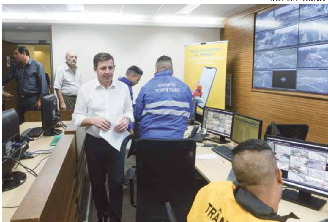
Morando: "é mais um canal para dar eficiência para nossos motoristas que buscam rotas alternativas"

Desenvolvido pela Secretaria de Comunicação, em parceria com a Secretaria de Transportes e Vias Públicas, por meio do Departamento de Trânsito de São Bernardo, e a Secretaria de Segurança Urbana, o canal entra em funcionamento hoje (19) no aplicativo São Bernardo na Palma da Mão , disponível nas lojas App Store e no Google Play. Os boletins da plataforma