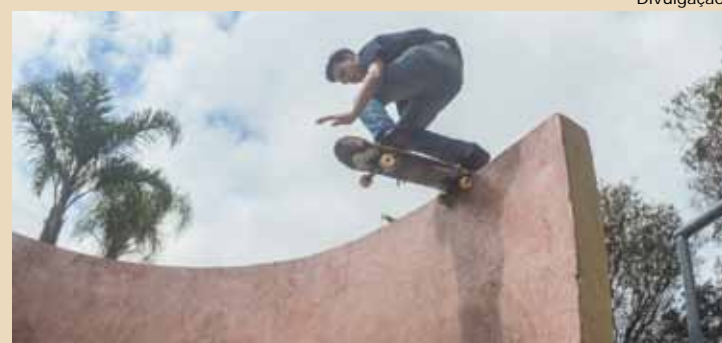
Torneio conta com as categorias mirim, iniciante, feminino e amador