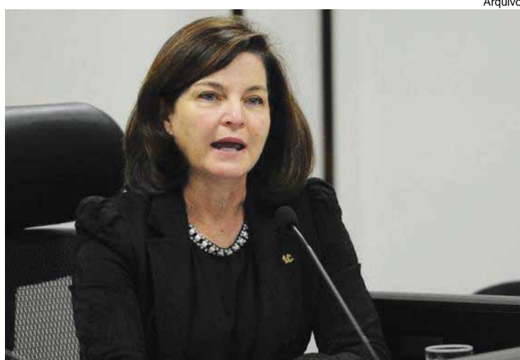
Raquel Dodge deixou o cargo de procuradora-geral