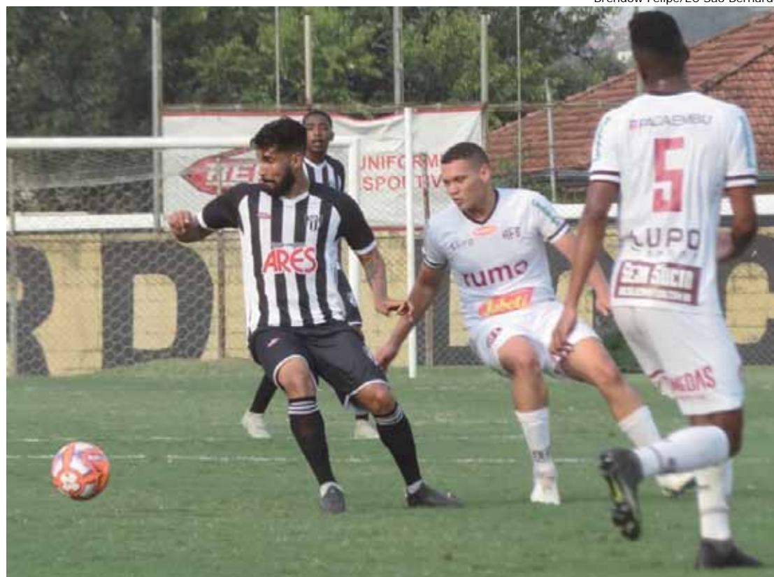
Cachorrão e Ferroviária fizeram duelo equilibrado, mas gol contra no final definiu a partida