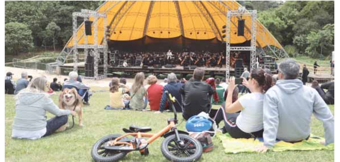
‘Circo em Concerto’ contará com músicas de repertório e outros temas que darão vida aos números circenses

Para quem gosta de cinema, neste fim de semana a Escola Livre de Cinema e Vídeo exibirá cinco produções nacionais. A programação tem início na quinta-feira, às 17h, com o filme ‘Bröder’, do diretor Jefferson D., que mostra os caminhos toma-