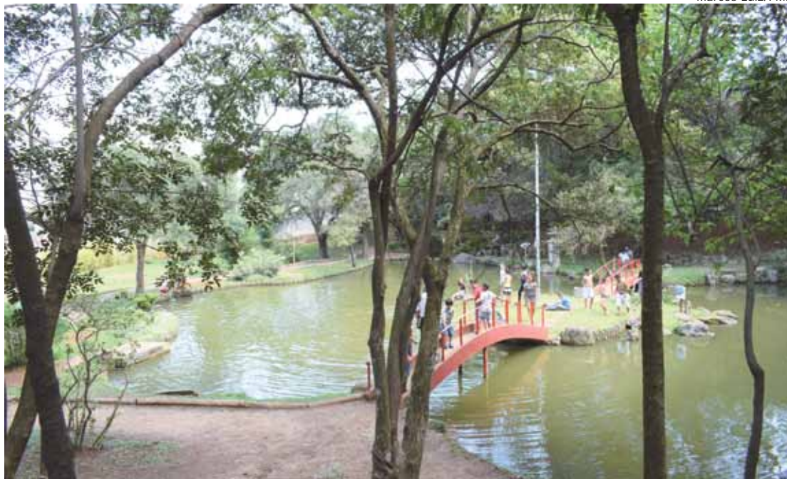
Com características de jardim japonês, o Parque Takebe possui passarelas sobre lago e trilhas sob o bambuzal

“O festival nasceu de duas ideias: homenagear o grande número de famílias japonesas de Diadema e referenciar o Parque Takebe, um amplo jardim japonês, como espaço de contemplação da natureza oriental. Essa será a terceira edição do evento e esperamos um pú-