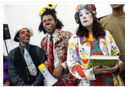
Os Anfitriões: Calabreza e Reco-Reco