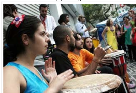
A batucada e os batuqueiros!