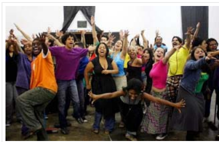
"Se fogo não queimasse, eu tomava banho de labareda"