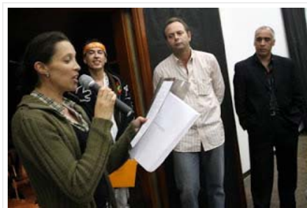
A leitura da Carta