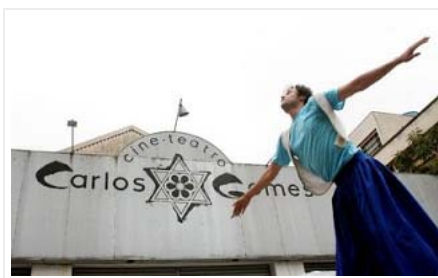
O Cine Teatro, que abrigou nosso ATO!