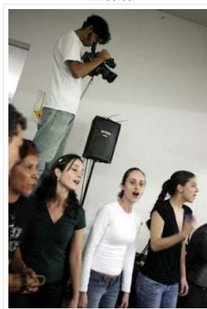
E o pessoal do cinema registrando tudo!

Provocação de: Movimento Livre Santo André às 15:28 Marcadores: Ato Público , Movimento Livre SA