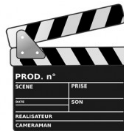
Inscrições são para dois cursos de cinema gratuito.