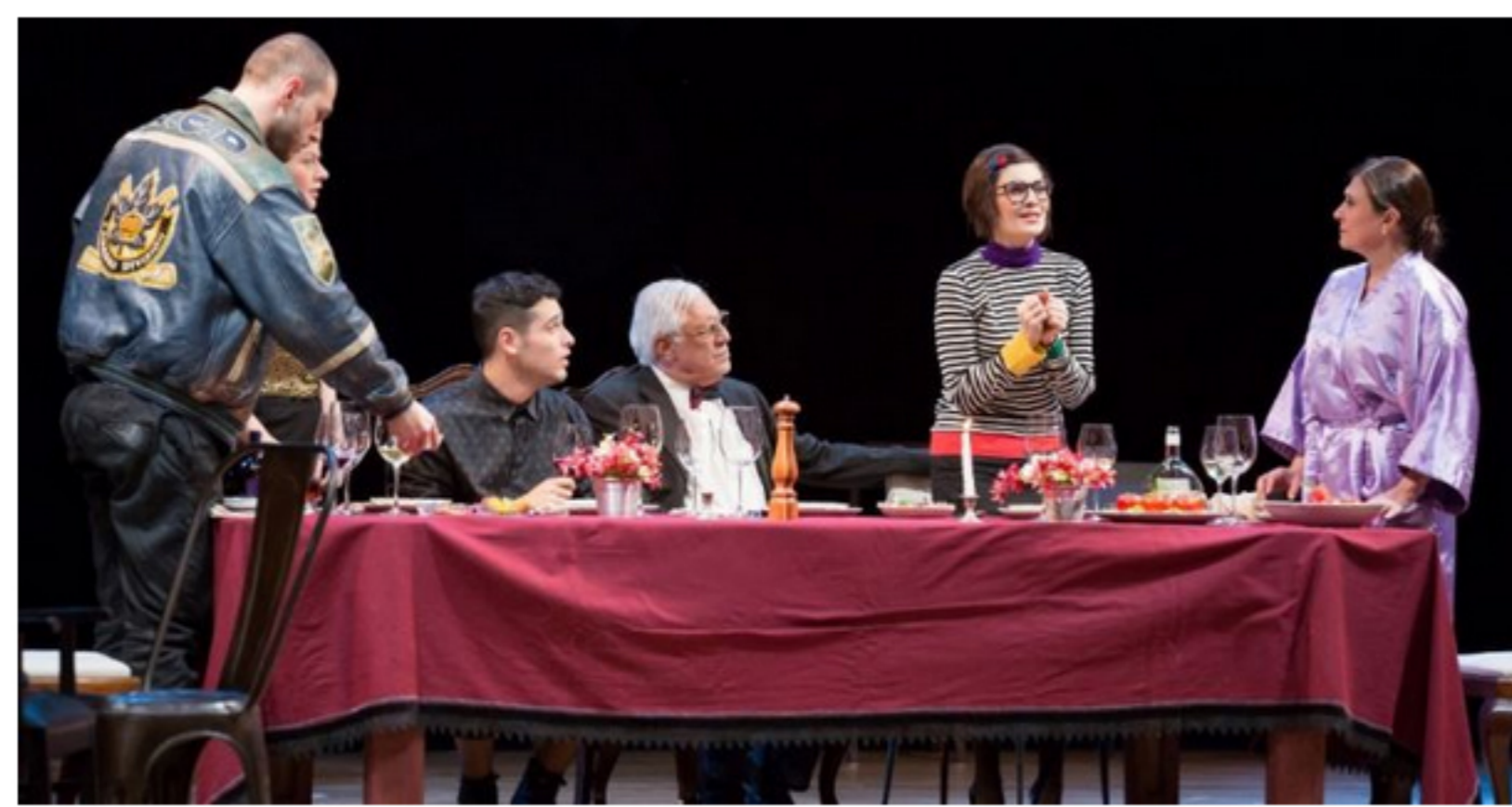
Devido à grande procura, "Tribos" terá uma sessão extra no sábado às 19h

Quarta, 13 Maio 2015 11:37 Escrito por Marcos Luiz Imbrizi tamanho da fonte - +