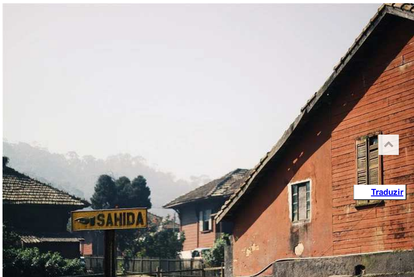
Vila de Paranapiacaba

Você pode fazer esse passeio pegar esse trem aos domingos, embarcando às 8h30 a Estação da Luz ou às 9h na Estação Prefeito Celso Daniel – Santo André. O retorno é às 16h30 em Paranapiacaba. O bacana é passear no trem fabricado na década de 1950, são 48km, leva 1h30 pra chegar até Paranapiacaba. Valor do trem: Em torno de R$30 por pessoa, quanto mais pessoas forem, aumenta o desconto no pacote.