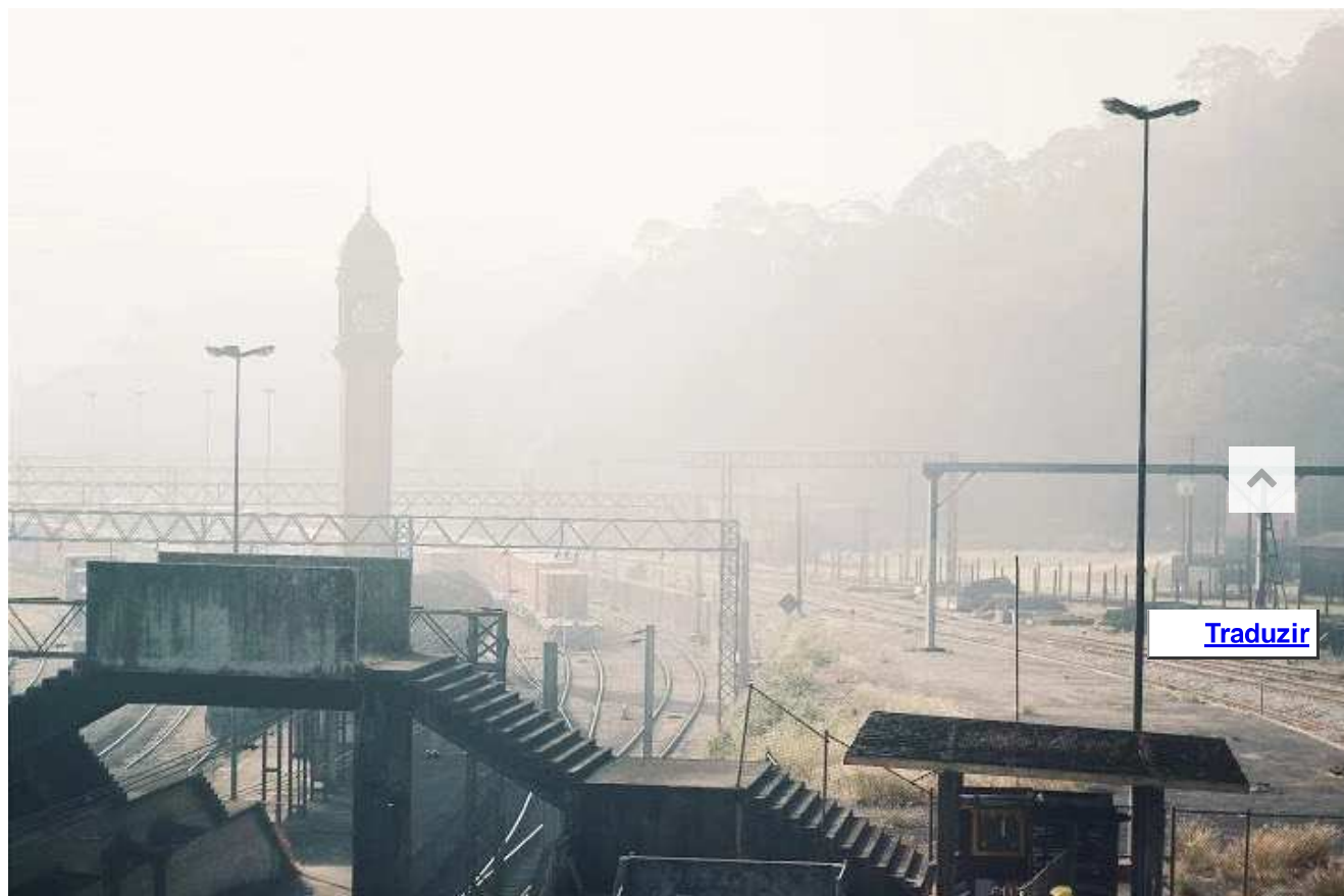
Relógio Big Ben da Vila de Paranapiacaba