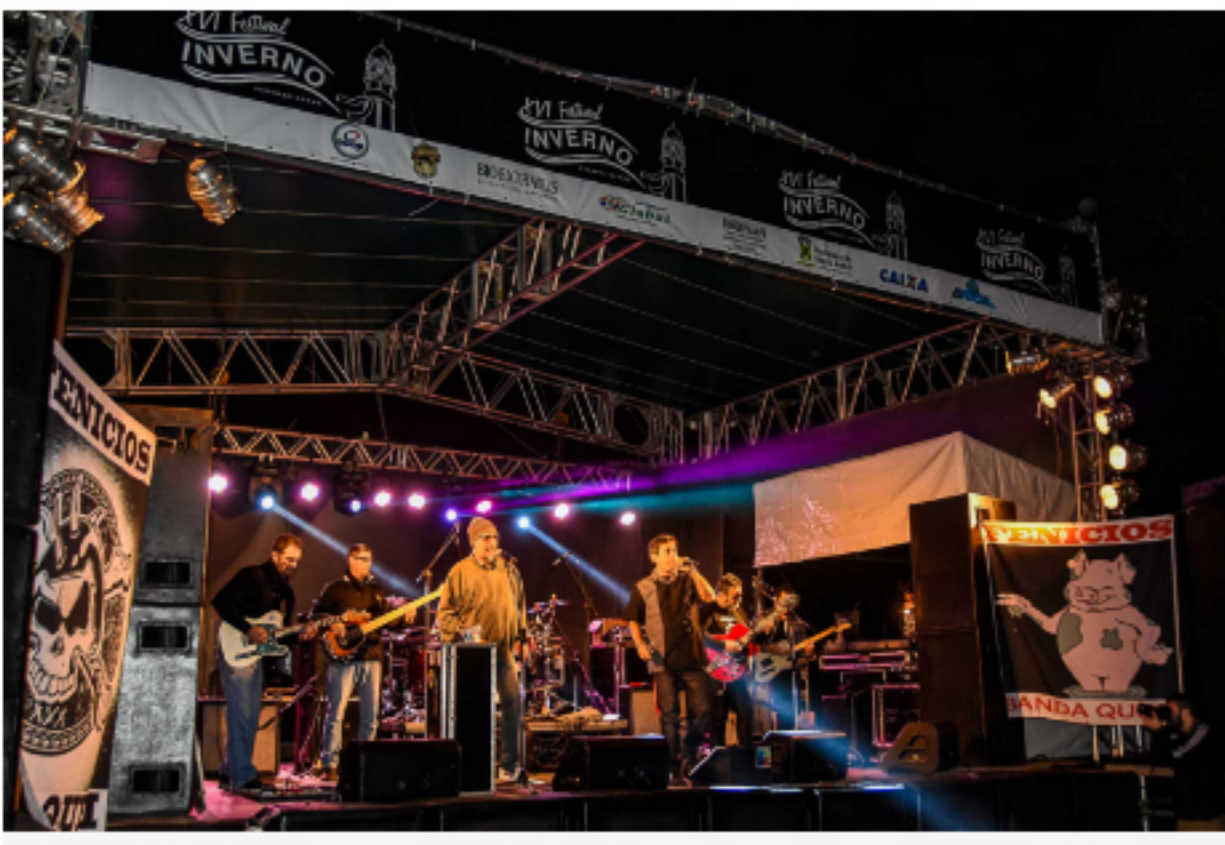
Apresentação da Fenícios Banda Quem