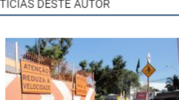
Sto. André espera bênçãos federais a projeto viário do BID em janeiro