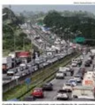
Um trecho movimentado de uma rodovia, com muitos veículos trafegando.

O ministro de Infraestrutura, Sérgio de Toledo, afirmou que o governo federal não conseguiu resolver a greve nacional de caminhoneiros. Segundo ele, a greve não foi resolvida e o transporte de cargas continua sendo afetado.